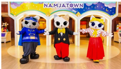
▲「ナンジャタウン」のパークキャラクター 左からモジャヴ、ナジャヴ、ナジャミー

まだまだ寒い日が続きますが、かわいくて愉快的なナジャヴ・ナジャミー・モジャヴの動画に癒されたあとは、気候に左右されず楽しめる屋内施設「ナンジャタウン」「屋内・冒険の島 ドコドコ」「VS PARK」「トンデミ」で、寒さを忘れて、アトラクションやアクティビティをお楽しみください。