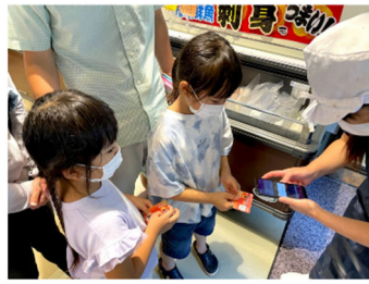
釣った魚を地域通貨と交換