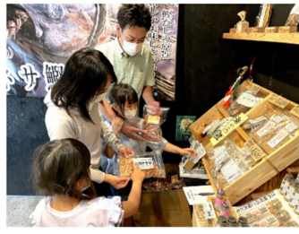
交換した通貨でお土産を買おう