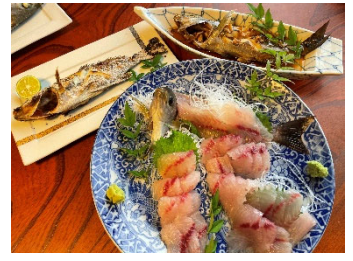
釣った魚は食べることもできます