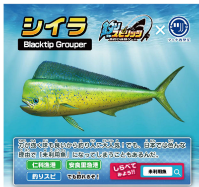
オリジナルステッカーデザイン