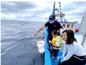
地元の漁師さんがレクチャー