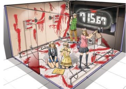
▲ミッション CUBE 体験イメージ