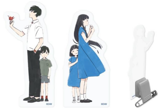
アクリルクリップセット 販売価格 1,320 円(税込)