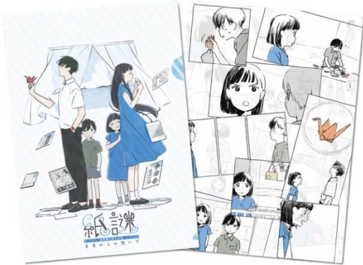
オリジナルクリアファイル・謎用紙セット 販売価格 1,100 円(税込)

デライトワークスの公式オンラインストア「DELIGHTWORKS STORE」で発売中の、『紙謎 未来からの想いで』をより楽しく遊んでいただけるための2種類のオリジナルグッズを、コラボカフェでも販売いたします。