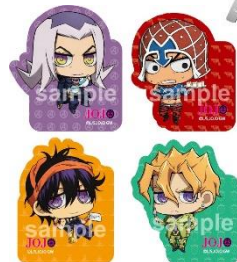
ダイカットステッカー (全 6 種)