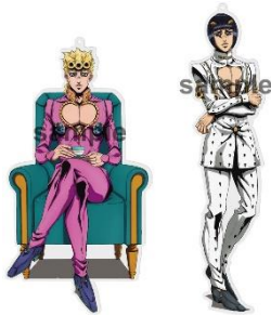
アクリルキーホルダー(全2種/各1,200円)