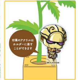
ジオルノの植物栽培キット(全1種/1,800円)