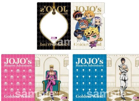
A4クリアファイル(全3種/各378円)