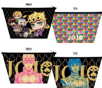
ポーチ (全 2 種)