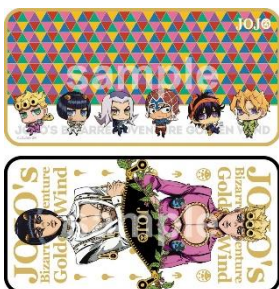
マルチクロス (全 2 種)