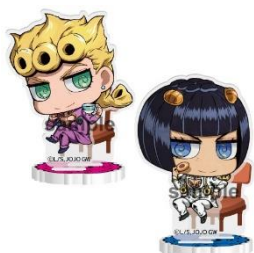
アクリルスタンド (全 6 種)