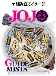
ミスタのアクリルアートスタンド(全1種/2,000円)