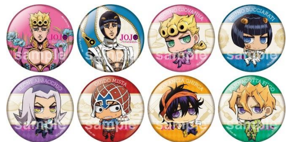
缶バッジコレクション(全8種/1個400円) ※ランダム封入