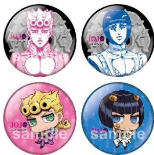
56mm缶バッジ (全 8 種)