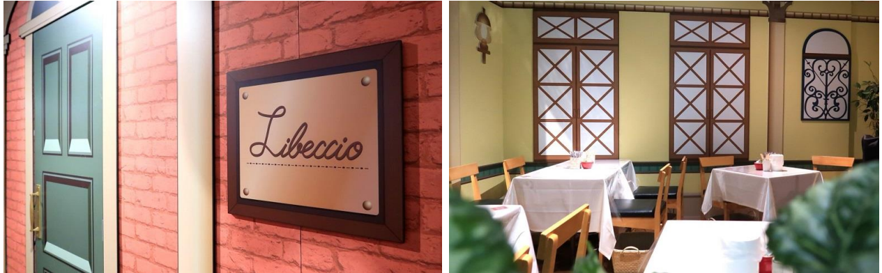
▲アトラクションイメージ

作中に登場するレストランを再現したシアター型アトラクションです。「Italy」・「Neapolis」の2つのストーリーから1つを選び、紅茶やクッキーを楽しみながら作中の場面の1人となったような体験ができます。