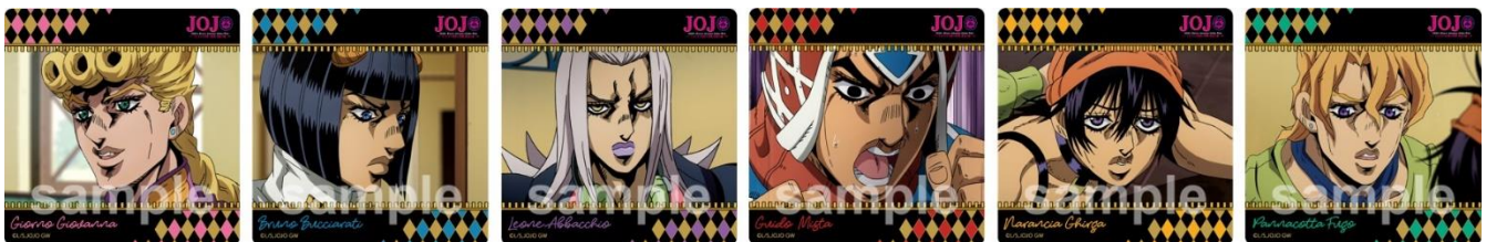
コースター(全6種) ※ランダム配付

【特典】 アトラクションを体験いただいた方には、コースターを1枚プレゼントします。