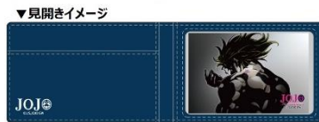
ジオルノのパスケース(全1種/1,900円) ※3月下旬販売予定