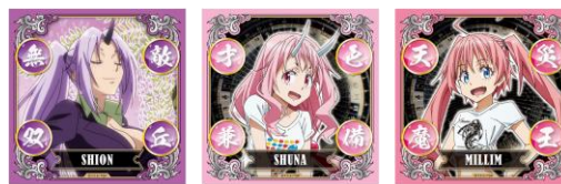
素晴らしい名前をありがとうございます!賞 プラステッカー(全10種)※ランダム配付