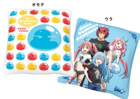
超素晴らしい名前をありがとうございます!賞 クッション(全1種)

あなたもリムル様に素晴らしい名前を付けてもらおう!サイコロの面に書かれた名前に応じてオリジナル賞品がもらえます。