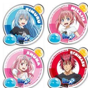
B賞 アクリルバッジ(全8種)