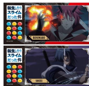
C賞 プラステッカー(全10種)※ランダム配付