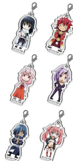
デフォルメチャーム(全6種) ※ランダム配付