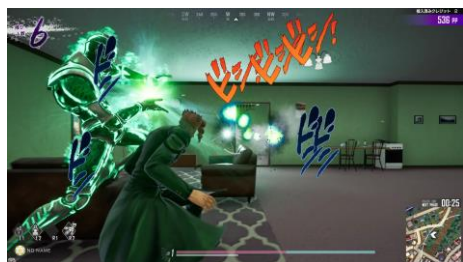
街に潜んだ他プレイヤーを スタンド能力を駆使して倒していこう！