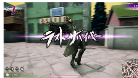
緊迫した心理戦を制し、 最後まで生き残ったプレイヤーが勝利！