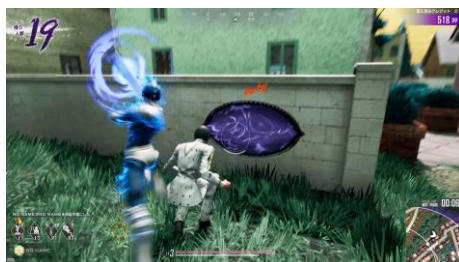
様々なスタンド能力を持つ キャラクターが登場！