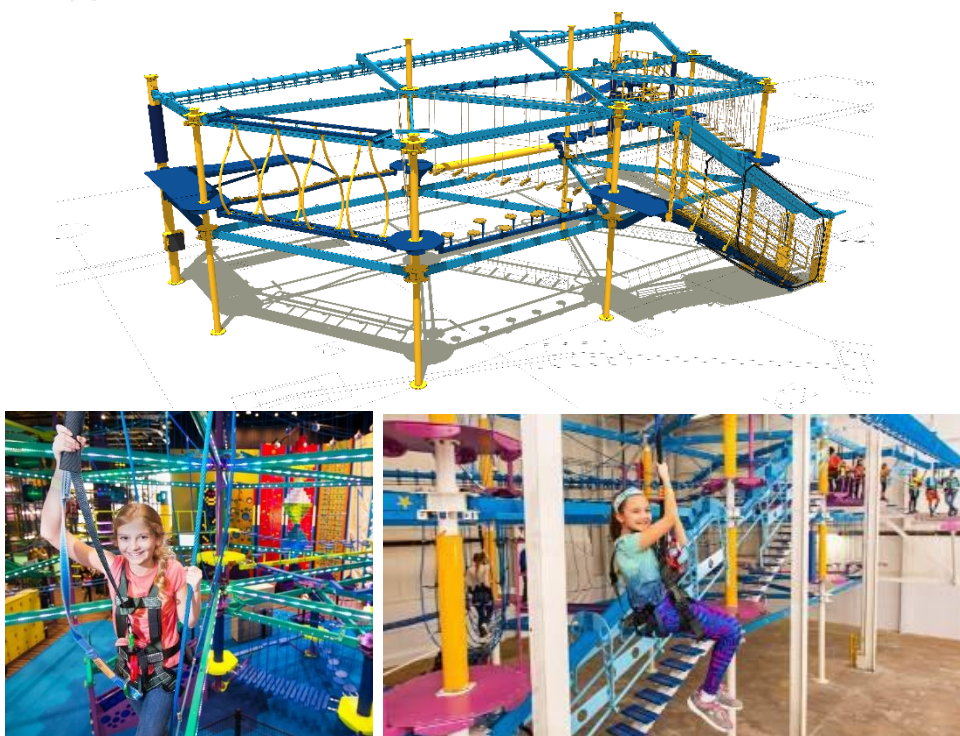
アクティビティのイメージ ※「Sky Trail®Discovery」は米 ROPES COURSES 社の商標です。

このアスレチックには「オーバートラッキングシステム」という安全システムを導入しており、プレーヤーの頭上に配置されたレールとプレーヤーの身体が安全ロープで繋がれているため、高い場所の綱渡りやジップラインのようなスリリングなセクションも安全に楽しくチャレンジできます。また「オーバーヘッドトラッキングシステム」は高所でロープを繋ぎ替える必要がないため、今までのロープアスレチックよりもより簡単かつ安全に体験できます。【ご利用対象】身長110cm以上体重20kg～120kgの方。小学生以下のお子様には必ず保護者(高校生不可)の付き添いが必要です。