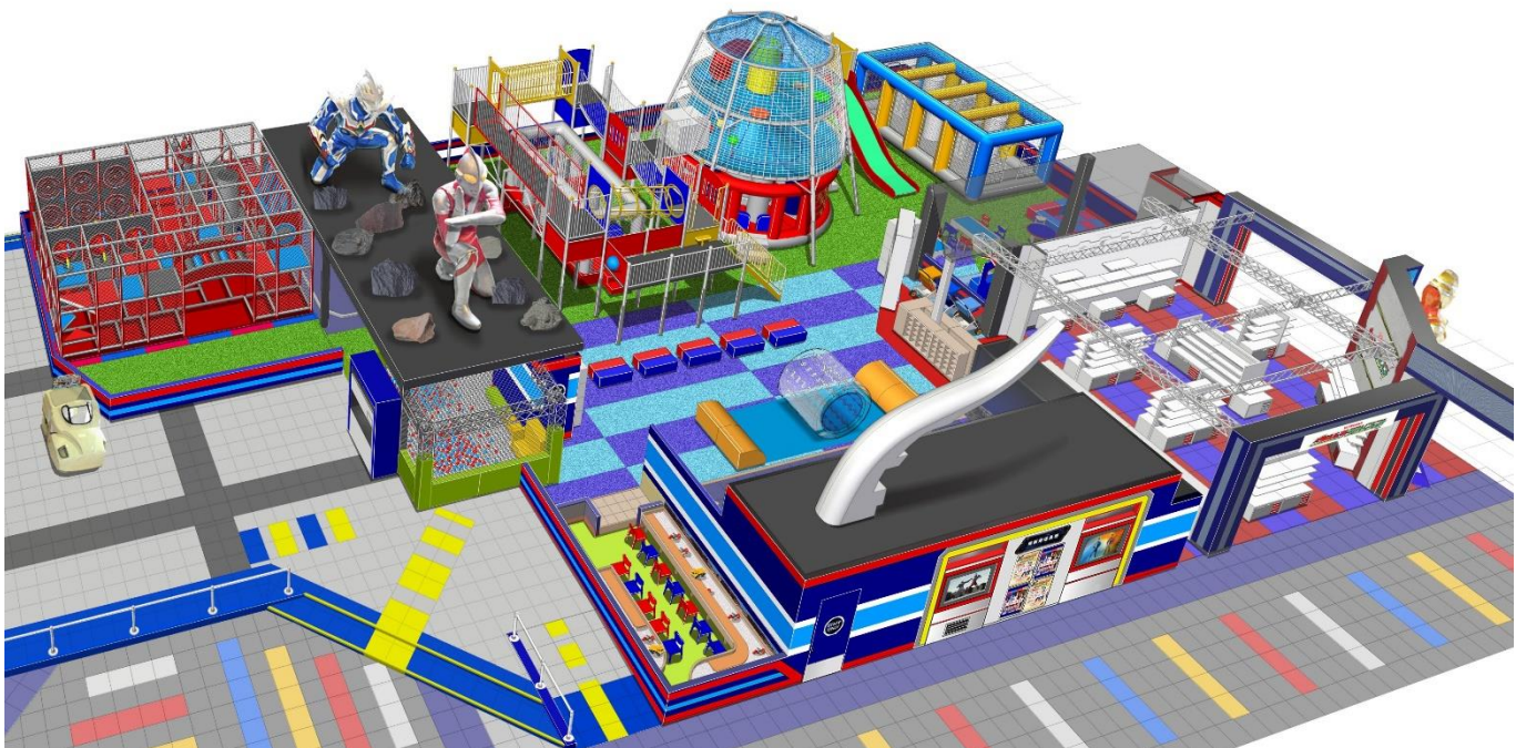
施設イメージパース

※ウルトラヒーロー登場日は公式ホームページをご参照ください https://bandainamco-am.co.jp/kids/ultra_athletic/