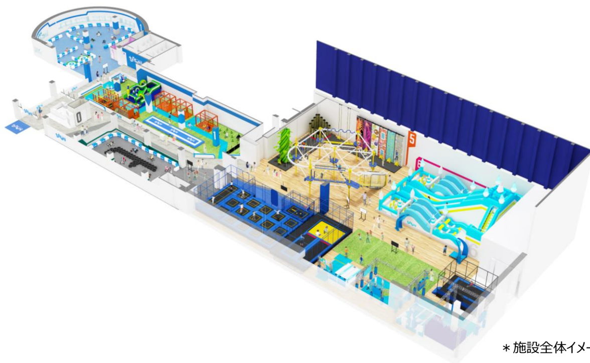
* 施設全体イメージ

株式会社バンダイナムコアムusement(本社：東京都港区／社長：萩原仁)は、次世代型屋内アスレチック施設『SPACE ATHLETIC“TONDEMI KUWANA”(スペースアスレチック “トンデミ クワナ”)』を2019年4月18日、イオンモール桑名（三重県桑名市）にオープンします。