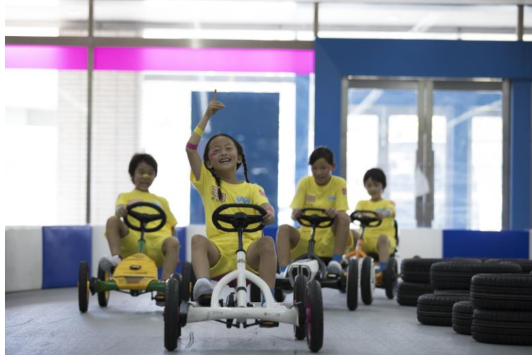
* アクティビティ体験イメージ

カートはペダルを漕ぐことで動き、ハンドル操作も簡単なため、親子や仲間で盛り上がること間違いなしです。