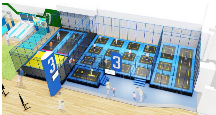
*トランポリンエリアイメージ