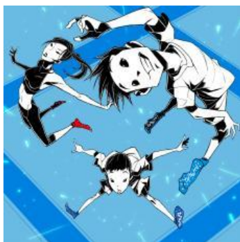
フリートランポリン