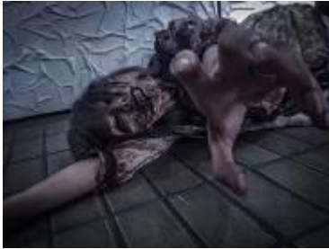
<ゾンビメイクイメージ>

※ゾンビメイクを施したナビゲーターの店内回遊、ワンポイントゾンビペイントのサービスは6月29日(土)、30日(日)の2日間限定のサービスとなります。