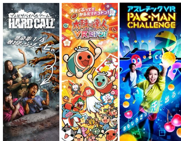
<新アクティビティキービジュアルイメージ>