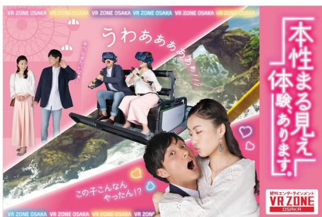
<新キービジュアルイメージ>

*1 ドラゴンクエスト VR 及び CG STAR LIVE のご利用には、別途専用の利用券が必要です。