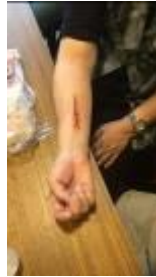
<ワンポイントゾンビペイントイメージ>