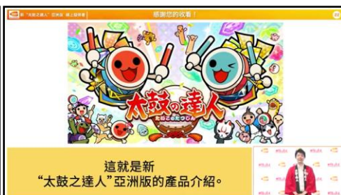
▲プレゼンテーションの様子(繁体字幕)