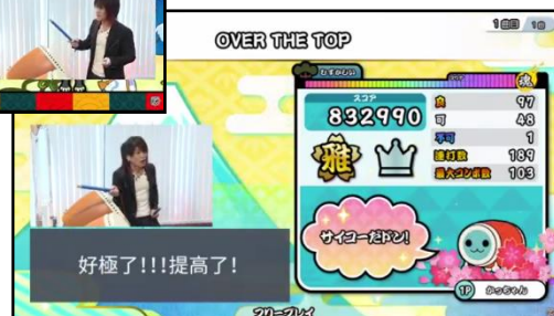
▲オンライン発表会の様子(繁体字幕)