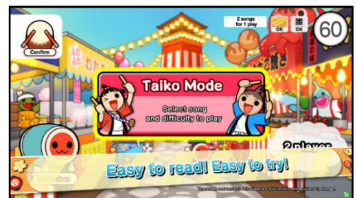
▲英語版 PV より抜粋