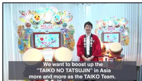
▲オンライン発表会の様子(英語字幕)

2021年に、『太鼓の達人』の最新バージョン(愛称「ニジイロVer.」)をアジアの皆さまにお届けする準備が、いよいよ整いました。アジアでも、『太鼓の達人』の魅力をさらに楽しんでいただけるようになります。私たちは、長い間アジアの『太鼓の達人』を支えていただいた太鼓ファンの皆さまに、しっかり喜んでいただきたいと考えました。そのため、まず2021年には、アジアの太鼓ファンの方に楽しんでいただける内容を優先して提供しようと考えています。その間に、より広いお客さまに楽しんでもらうための準備を進め、2022年以降に、次の段階として、ファミリーやライトゲーマーの方に、さらに知ってもらい、楽しんでもらえるように、ゲームの内外を盛り上げていきます。