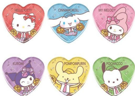
ハート型缶バッジコレクション(全6種)