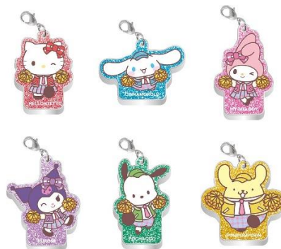
アクリルチャーム(全6種)