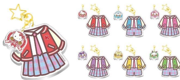
チャーム付きキーホルダー(全6種)