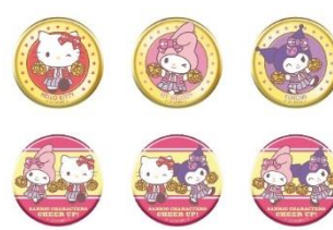
C賞：56mm缶バッジ (全6種) ※ランダム配付