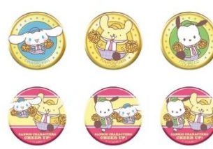
C賞：56mm缶バッジ (全6種) ※ランダム配付