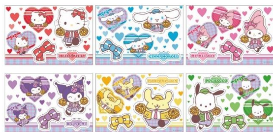
クリアステッカーコレクション(全6種)