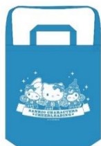
A賞：デニムトートバッグ (全1種)