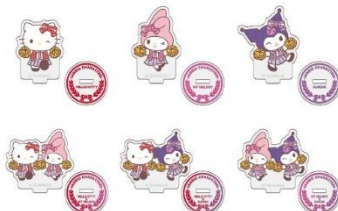
B賞：アクリルスタンド (全6種)