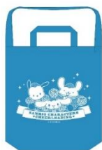
A賞：デニムトートバッグ (全1種)