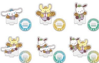
B賞：アクリルスタンド (全6種)