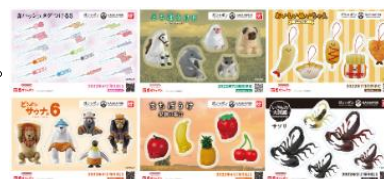
▲オリジナルステッカー(全6種)

https://bandainamco-am.co.jp/others/gashapon-bandai-officialshop/app/