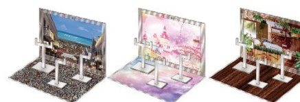
▲おうちでガシャ撮り(全1種) ※付属背景(全3種)

※ニュースリリースの情報は、発表日現在のものです。発表後予告なしに内容が変更されることがあります。あらかじめご了承ください。