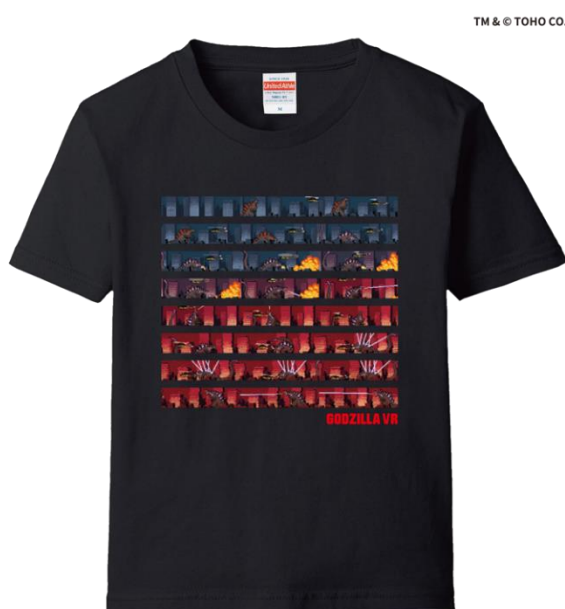
ゴジラ VR T シャツ

なお、一部のオリジナル商品は、「VR ZONE OSAKA(大阪・梅田)」 https://vrzone-pic.com/osaka/ でも販売いたします。