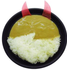
野菜は嫌いじゃ！ポイ！カレー 価格：1,000円