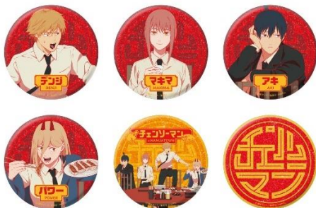
缶バッジコレクション (全6種) 価格：1個700円 ※ランダム封入