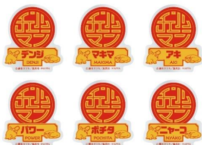
ネームバッジ (全6種) 価格：1個770円 ※ランダム封入