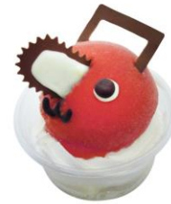
ポチタのアイス 価格：1,000円