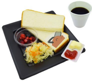
最高じゃあないっすか朝食プレート 価格：1,300円