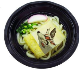
「コン」-狐の悪魔冷やしうどん- 価格：990円