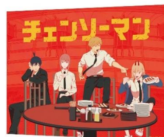
【オンラインストア限定商品】 キャンバスボード (全1種) 価格：8,800円

※ニュースリリースの情報は、発表日現在のものです。発表後予告なしに内容が変更されることがあります。 ※価格は全て税込です。