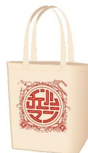
トートバッグ (全1種) 価格：2,200円