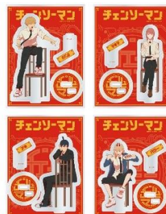
アクリルスタンド (全4種) 価格：各1,870円