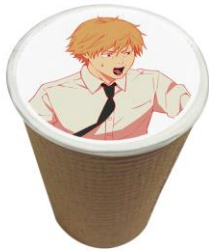
フォーチューンラテ(全4種) 価格：各690円