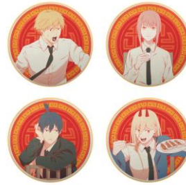
アイシングクッキー