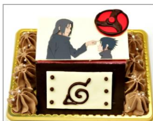
イタチとサスケのケーキ (サワーチェリーケーキ) (670円)

レアチーズケーキに、赤色と白色のチョコレートを使ってうちはのマークを表現しました。