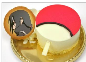
うちはのケーキ (レアチーズケーキ) (620円)

レアチーズケーキに、赤色と白色のチョコレートを使ってうちはのマークを表現しました。