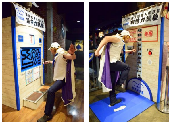
「集中力」と「根性力(体力)」を測る2種類のトライアルゲーム