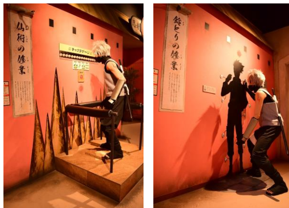
「バランス感覚」と「反射神経」を測る2種類のトライアルゲーム