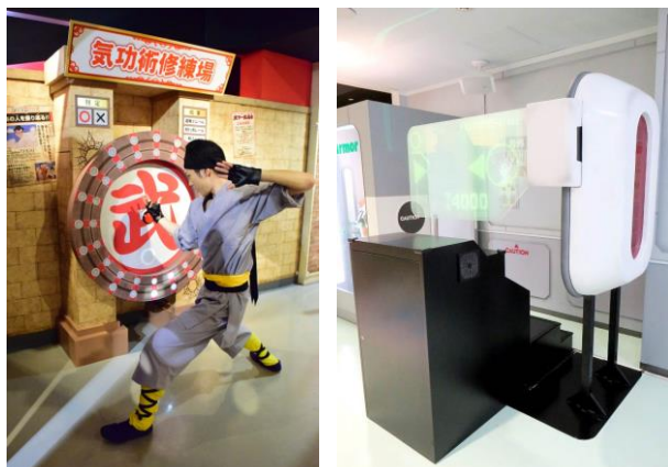
「動体視力」と「戦闘力」を測る2種類のトライアルゲーム