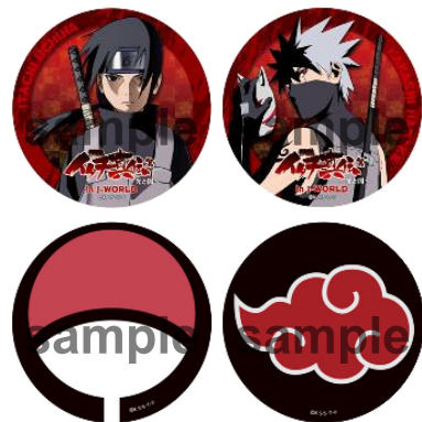
56mm 缶バッジ/全9種 (1個 378円) ※ブラインドパッケージ仕様