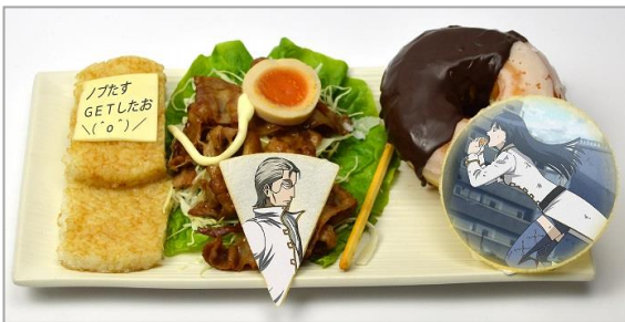
異三郎と信女の日常 ノブたすフィッシングプレート (820 円)

信女の好物のドーナッツを使って、異三郎が信女を釣っている様子を表現したメニューです。ライスバーガーで異三郎のトレードマークの携帯を、煮たまごのスライスとマヨネーズで片メガネを表現しています。