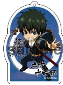
アクリルストラップ (3種)