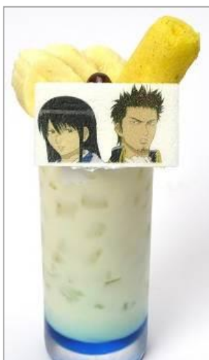
「俺達にもう敵はいない」 近藤と桂の最強タッグバナナオレ (650 円)

真選組の隊服を黒色のケーキで表現しました。ケーキの上には、近藤・沖田・土方をイメージし、チョコレートで作ったバナナ・アイマスク・マヨネーズを添えています。