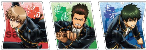
アクリルキーホルダー／全3種 (各 864 円)