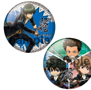
100mm 缶バッジ (4種)