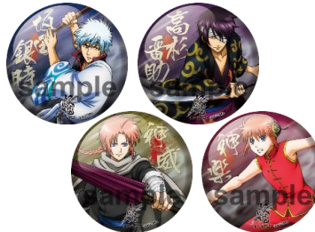
缶バッジ ver.2 (全7種／1個 378 円) ※ブラインドパッケージ仕様