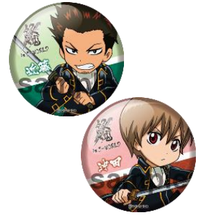
54mm 缶バッジ (6種)