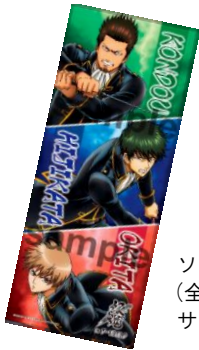
ソフトタッチフェイスタオル (全1種／2,484 円) サイズ：約 340mm × 850mm