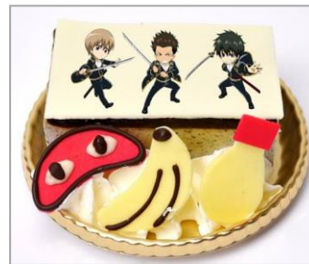
真選組ケーキ (黒ごまケーキ) (720 円)

信女の好物のドーナッツを使って、異三郎が信女を釣っている様子を表現したメニューです。ライスバーガーで異三郎のトレードマークの携帯を、煮たまごのスライスとマヨネーズで片メガネを表現しています。