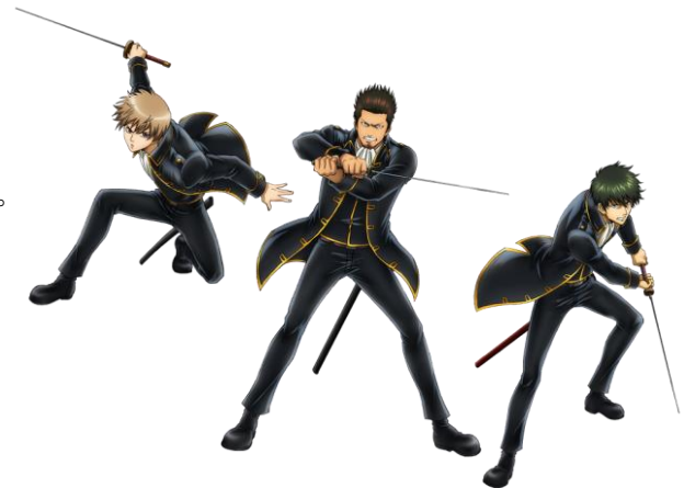
J-WORLD TOKYO 限定描き下ろしイラスト(等身) ちびキャラの描き下ろしイラストも登場！

「銀魂」(著：空知英秋)は、『週刊少年ジャンプ』(集英社)で連載中の人気SF時代劇コメディで、2006年にテレビアニメ化され、2015年4月から新シリーズが放送中です。