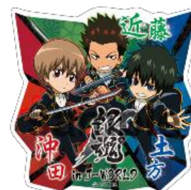
[大成功賞] アクリルバッジ(1種)