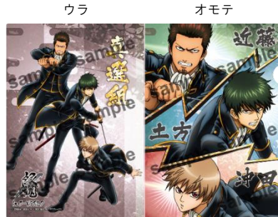
A4 クリアファイル (全1種／378 円)