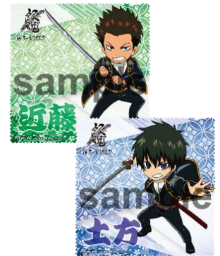
マイクロファイバーミニタオル (3種)