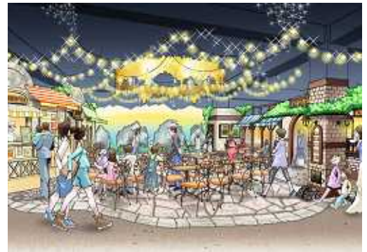
<施設完成イメージ>

この「東京ミートレア」は、ナムコの持つテーマパークのノウハウを生かし、京王電鉄株式会社が新設する複合商業施設「フレンテ南大沢」新館の集客核施設としての役割を担います。施設運営は京王電鉄が行います。20歳～40歳代の女性を中心に、ファミリーやカップルなど幅広い年代層をターゲットとし、初年度は130万人の集客を見込んでいます。