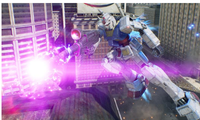
チャージショット