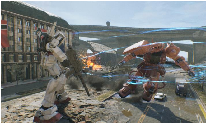
ブーストキャンセル