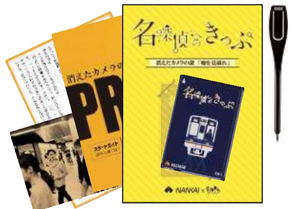
消えたカメラの謎 編のキット（イメージ）