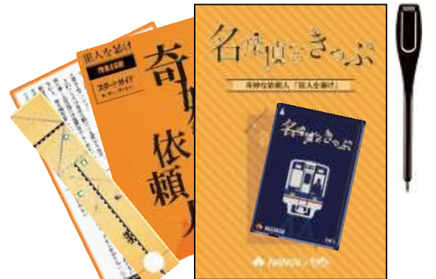
奇妙な依頼人 編のキット（イメージ）