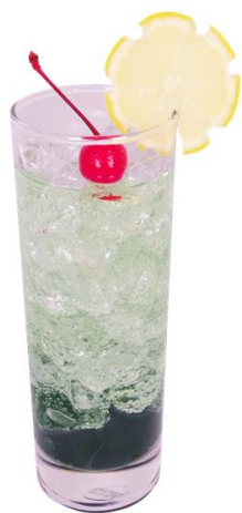
『ウルトラマン』 ドリンク