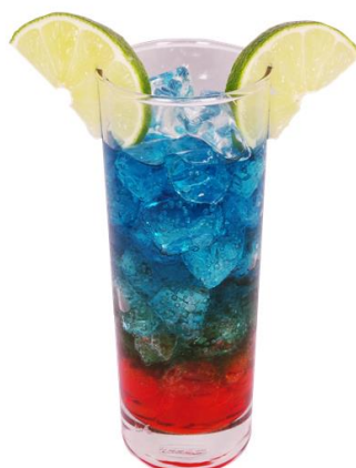
『ウルトラマンゼロ』 ドリンク