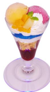
『ニュージェネレーション』 デザート 1,000円