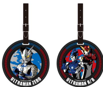
バッグタグ(全 6 種) 各 1,000円