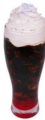
『ウルトラマンジード』 ドリンク