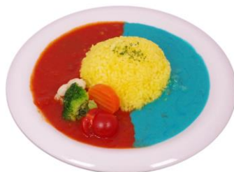
『ニューヒーロー』 フード 1,200円