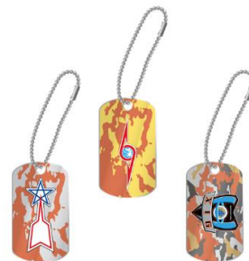
ドッグタグチャーム(全 6 種) ※ランダム封入 各 600円