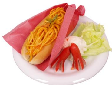
『レジェンド』 フード 1,000円