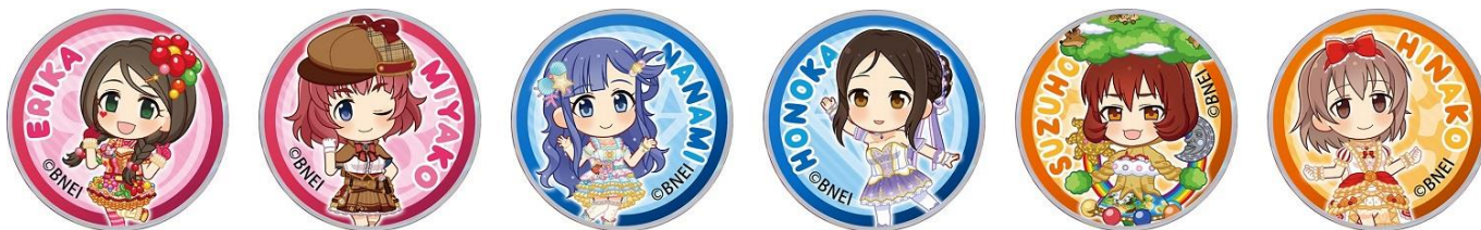
アイドルマスター シンデレラガールズ ぷちピンバッジ第7弾(全52種)

株式会社バンダイナムコアミューズメントは、「アイドルマスター シンデレラガールズ ぷちピンバッジ」第7弾を発売します。本グッズは2021年9月発売の第1弾から順次リリースしているシリーズ商品。第7弾の登場でアイドルマスター シンデレラガールズのアイドルたち190人が揃います。11月20(土)よりアイドルマスター オフィシャルショップ アトレ秋葉原店ほかにて取り扱いを開始します。