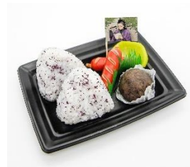
不死川玄弥のおにぎりセット 価格：1,000円