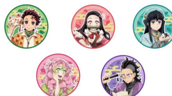
フォーチュンラテ(全5種)※7 価格：690円