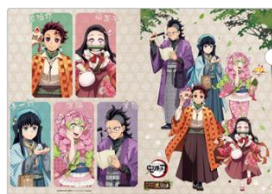
クリアファイル(全2種)