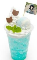
時透無一郎の霞ドリンク 価格：990円