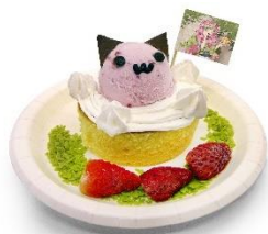
甘露寺蜜璃のふわふわスポンジケーキ 価格：1,200円