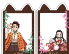
アクリルフォトコレクション(全5種)