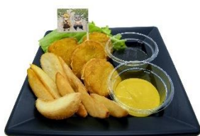
善逸と伊之助のポテナゲプレート 価格：1,100円