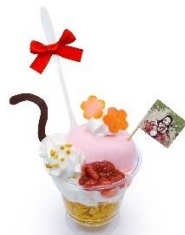
竈門禰豆子のミニパンナコッタパフェ 価格：980円