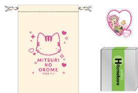
【店頭限定商品】ナンジャの里米 ※2 (全1種)