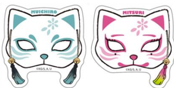
ねこ型バッジコレクション(全15種)