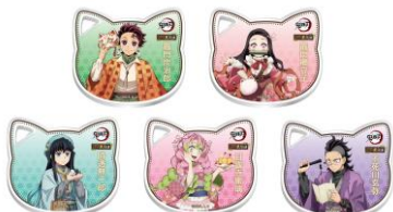
ねこ型アクリルコースター付きソフトドリンク※7 価格：980円