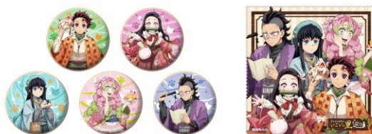
アイシングクッキー(全5種)※7 価格：単品 690円 ミニクリーンクロス(全1種)付き 1,800円