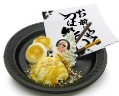
刀鍛冶の里、刀への想い和風甘味プレート 価格：1,100円