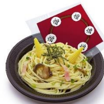
「極悪人共めが」憎珀天の和風パスタ 価格 1,150円