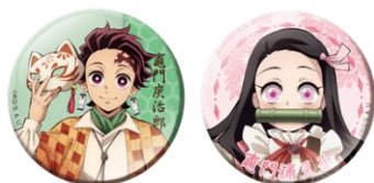
缶バッジコレクション(全10種)