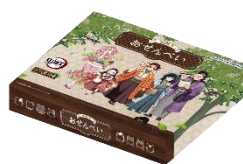
【店頭限定商品】おせんべい ※2 (全1種)