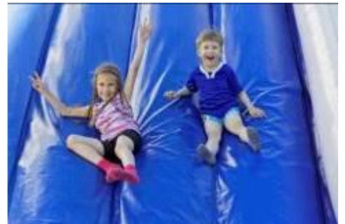
*エアランエリア体験イメージ