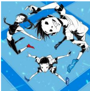
フリートランポリン