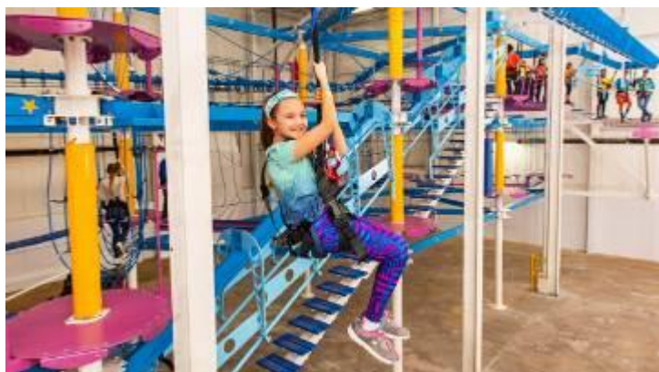
* ジップライン体験イメージ