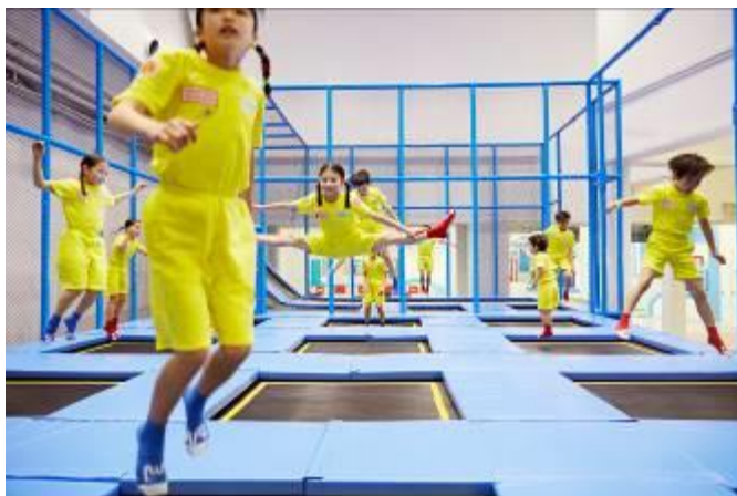
* アクティビティ体験イメージ