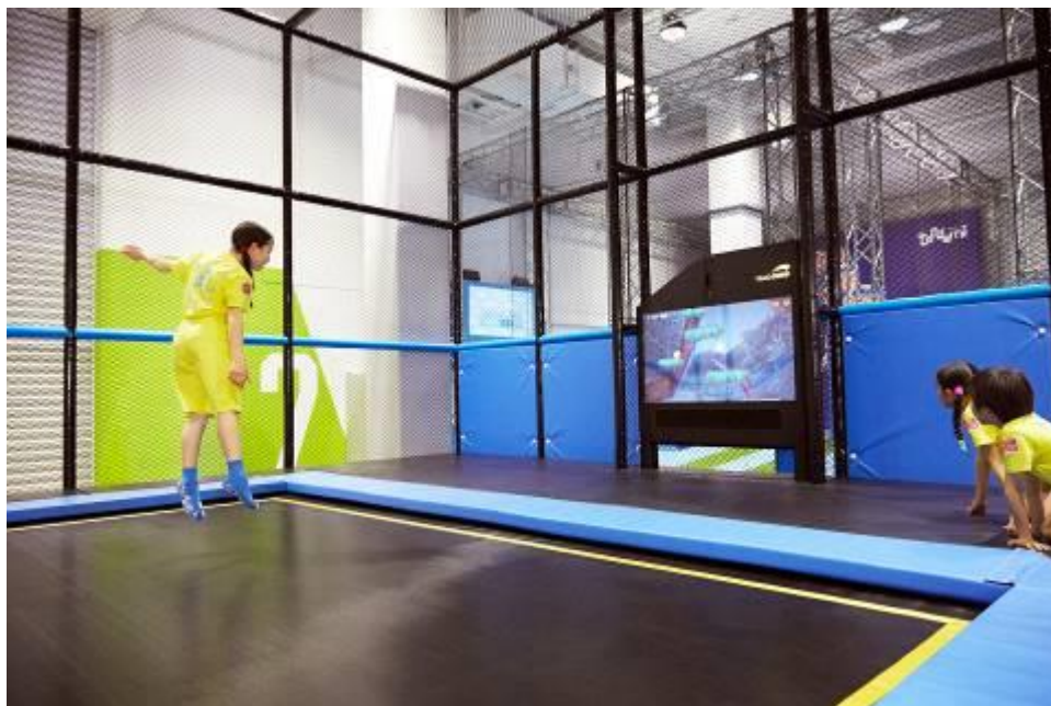
* Valo Jump 体験イメージ

トランポリンとゲームを融合させたアトラクションで、専用のトランポリンでジャンプする事で画面に映し出される自分自身を操作し、ジャンプをしてコインを集めたり、ゲーム内に出てくる敵を倒したり、まるで自分がゲームの中に入って主人公になったかのような気分で遊ぶことができます。