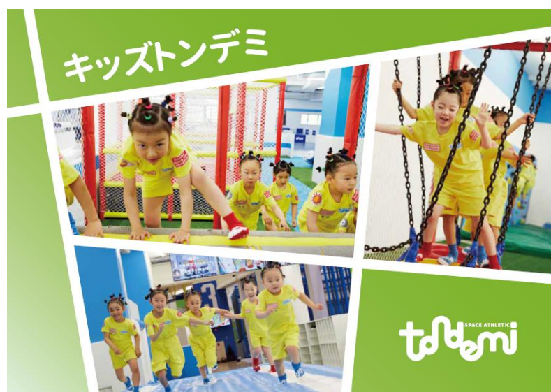
* アクティビティ体験イメージ