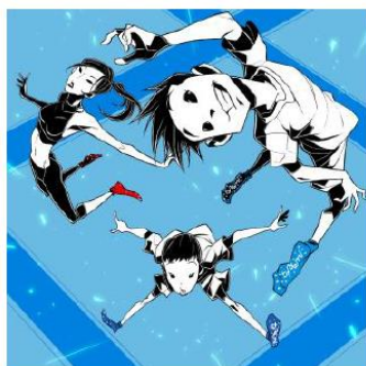
フリートランポリン