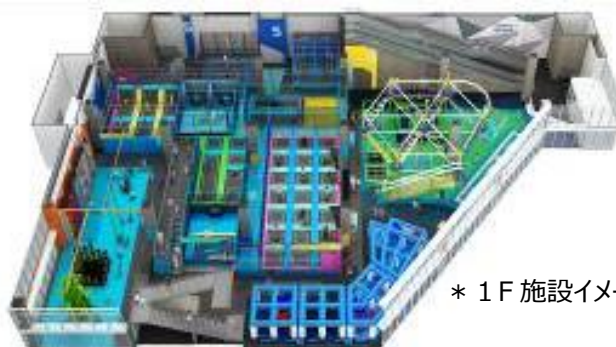
* 1F 施設イメージ

「TONDEMI(トンデミ)」は、トランポリンエリア、クライミングウォール、ロープウォークなどのアクティビティを大人から子供まで気軽に体験できる次世代型アスレチック施設です。幕張新都心店の開業以来テレビや雑誌等のメディアでも多数取り上げられており、「都市型アスレチック」のパイオニアとして首都圏を中心に全国から多数のご来場をいただいております。