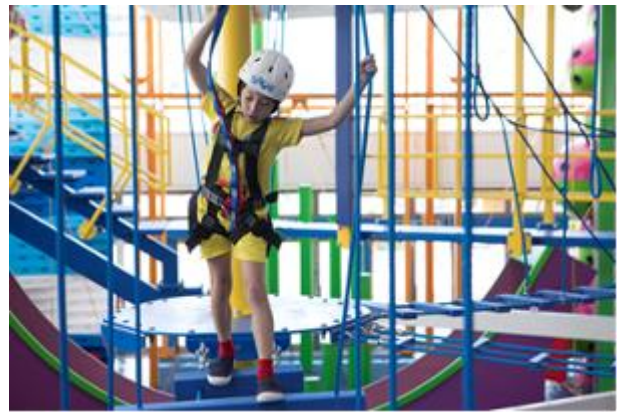
* アクティビティ体験イメージ

トンデミ愛媛店のロープワークエリアの直下には“キッズトンデミ”エリアがある為、ロープワークのチャレンジャーは眼下に“キッズトンデミ”で遊ぶお子様を見下ろすことのできるダイナミックなレイアウトとなっております。