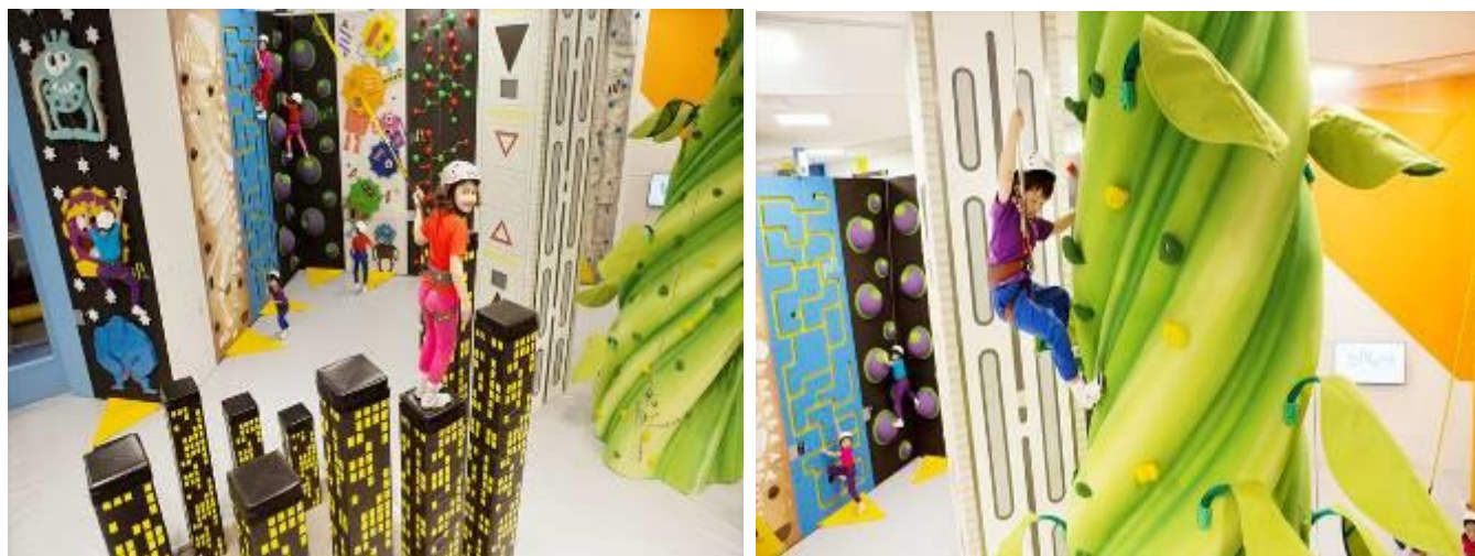
* アクティビティ体験イメージ

ウォールの高さは最大 6m。写真映えるカラフルな彩りで、デザイン性が非常に高いクライミングウォールを多数取りそろえております。