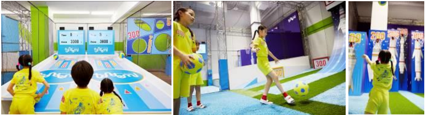
* アクティビティ体験イメージ

他にも、「サッカー」「バスケットボール」「ボウリング」などのスポーツをテーマにエンターテインメント性を加えた大人から子供まで一緒に楽しめるアトラクションを多数体験できます。