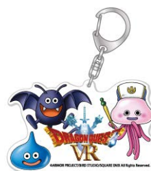
「アクリルキーホルダー」 480 円（税込 518 円）