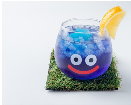
「スライムドリンク」 580 円（税込 626 円）