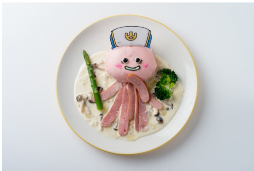
「ホミリーのオムライス」 1,280 円（税込 1,382 円）

カフェエリア「グランパーズ」では、ドラゴンクエストコラボフードを4月27日（金）より販売を開始します。 見た目だけでなく美味しさにもこだわったメニューです。