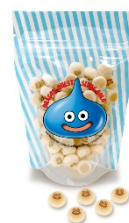
「ポーロ」 417 円（税込 450 円）