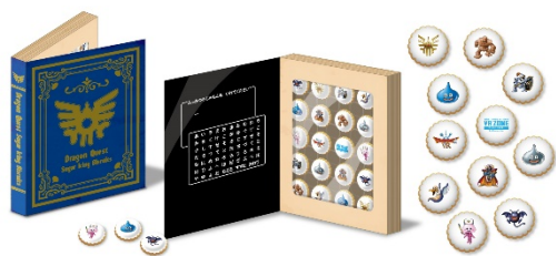
「アイシングビスケット」 800 円（税込 864 円）

VR ZONE Store では、アクティビティの稼働開始に先駆けて、コラボグッズを4月23日（月）より発売します。冒険の書をイメージしたアイシングビスケットなど、冒険の思い出をお土産としてぜひご購入ください。