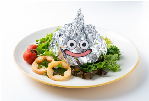
「メタルスライムの包み焼きハンバーグ」 1,380 円（税込 1,490 円）