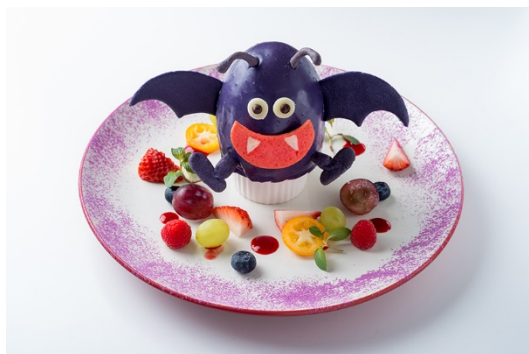
「ドラキーのレアチーズケーキ」 1,480 円（税込 1,598 円）