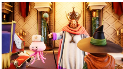
「国王の間」で旅のはじまり

『ドラゴンクエストVR』には、オリジナルキャラクターのホミリーが登場。新米冒険者のあなたをしっかりナビゲートしてくれるので、誰でも安心して遊ぶことができます。