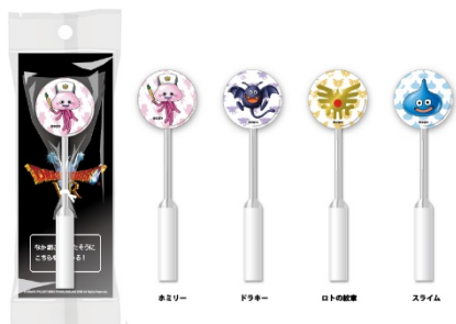
「フラッシュロリポップ」 各 556 円（税込 600 円）※全4種