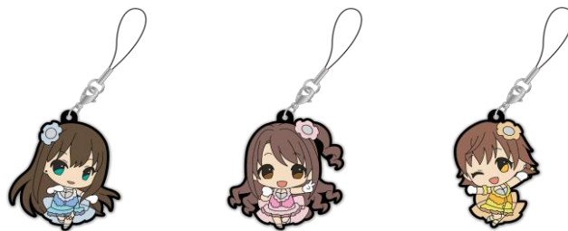
ラバーストラップ 3種 各800円(税込)