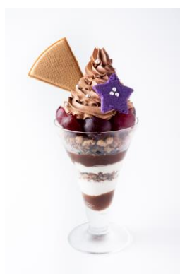
凜の Never say never チョコパフェ 1,800円（税込） 凜の衣装をモチーフにし、凜の好きなチョコを使用したパフェ!