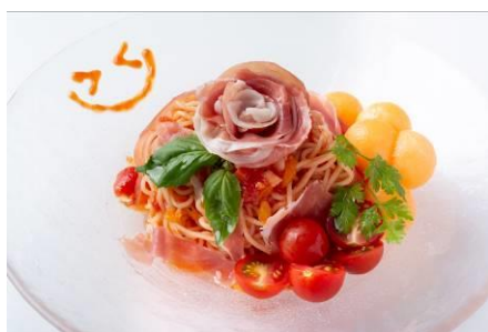
卯月のS(mile)ING!生ハムメロン冷製パスタ 1,800円（税込） 卯月の好きな生ハムメロンをモチーフにした冷製パスタ!