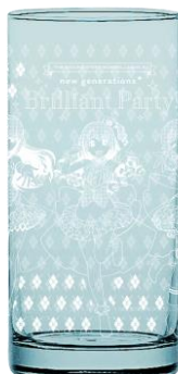
ロンググラス 1,500円(税込)