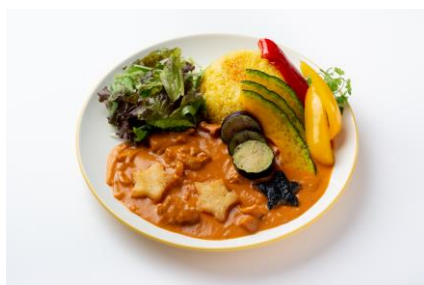
未央のミツボシ☆☆☆バターチキンカレー 1,800円（税込） 未央の元気なイメージにぴったりなカレーにポテトのミツボシ☆☆☆をトッピングしたオリジナルカレーライス!