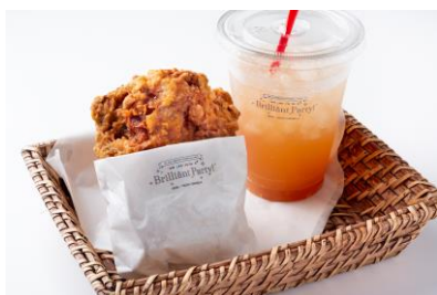
フライドチキンとエナジードリンクセット 1,000円（税込） フライドチキンとエナジードリンクのセット! (エナジードリンクはジンジャーエールを提供します)