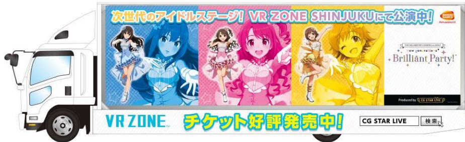
トラックデザインイメージ