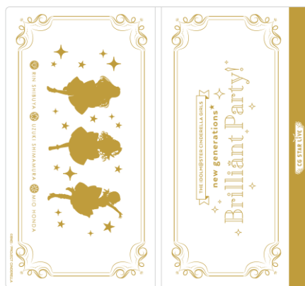
チケットホルダー 1,500円(税込)