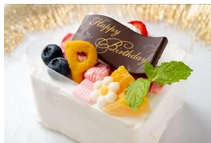
Happy Birthday! ミニケーキ 1,000円（税込） プロデューサーの皆さんへ、 アイドルたちの思いのこもった誕生日ケーキ!