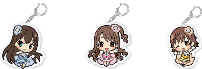
アクリルキーホルダー 3種 各700円(税込)