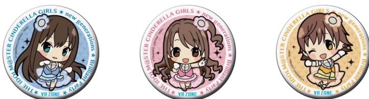
缶バッジ 3種 各600円(税込)