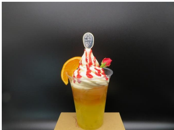
サンライトイエローオーバードライブ 山吹色の波紋疾走 オレンジティー