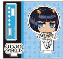
B賞：アクリルスタンド(全10種)