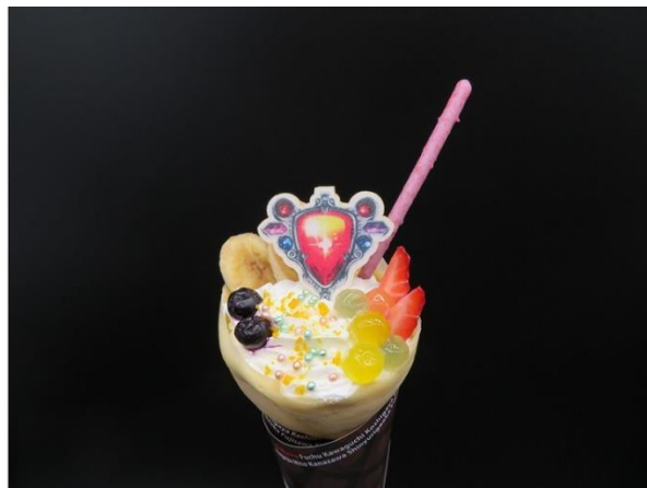
奇跡の完全結晶！ スーパー・エイジャ・フルーツクレープ