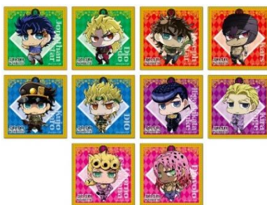
トレーディングステッカー(全20種) 価格：350円 ※ランダム2枚封入