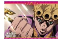
C賞：場面写真プロマイド(全20種)