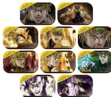
B賞：ガド丸缶バッジ(全10種)