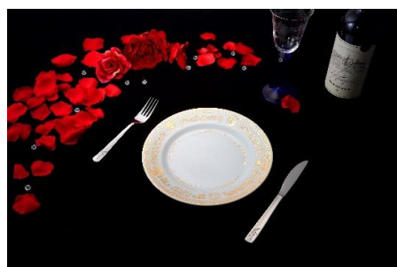
ジョースター家の晚餐セット(全1種) 価格：5,500円 ※皿とカトラリーのセットです