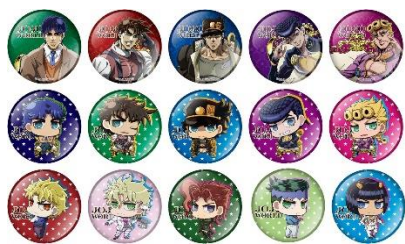
75mm缶バッジ(全15種) 価格：500円 ※ランダム封入