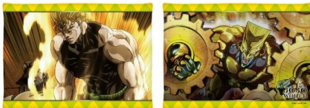
A賞：クッション(全2種)