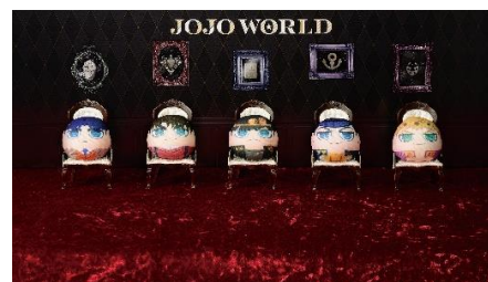
まるめいぐるみ(全5種) 価格：1,000円 ※ランダム封入