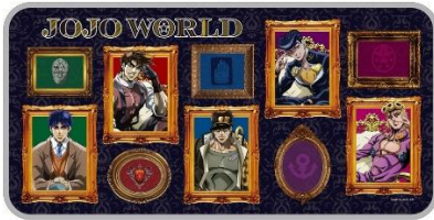
A賞：マルチクロス(全2種)