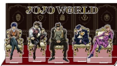
アクリルジオラマ(全1種) 価格：3,000円