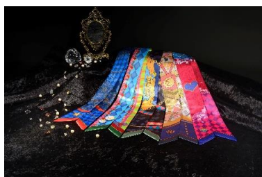
リボンスカーフ(全5種) 価格：1,800円