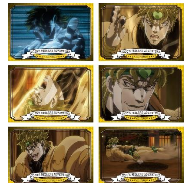
C賞：ポストカード(全15種)