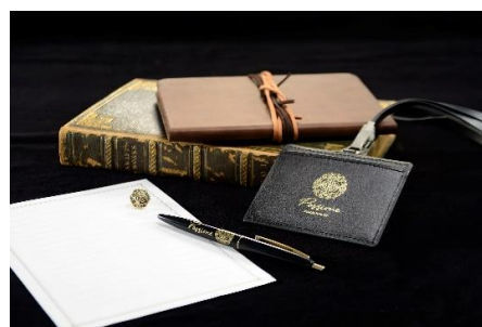
パッションネ入門セット(全1種) 価格：4,900円 ※パスケース、ボールペン、ピンバッジ、メッセージカードの4点セットです