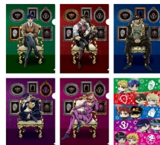
クリアファイル(全6種) 価格：450円