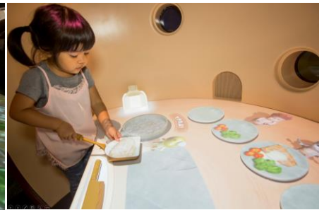
▲草原エリア「はらぺこキッチン」