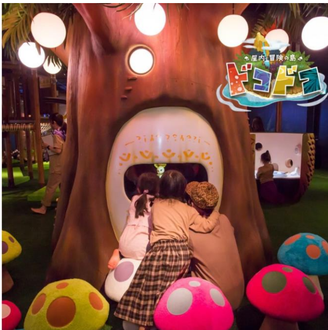
▲『屋内・冒険の島 ドコドコ』 草原エリア「きのこのき」

株式会社バンダイナムコアミューズメント(本社:東京都港区/社長:萩原仁)は、2021年3月21日(日)にオンライン表彰式にて発表された「デジタルえほんアワード 2020」(主催:国際デジタルえほんフェア実行委員会)において、当社が企画・運営する『屋内・冒険の島 ドコドコ』(東京都立川市)が審査員特別賞「川村 真司賞」を受賞しました。