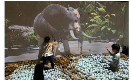
▲ジャングルエリア「どろんごジャングル」