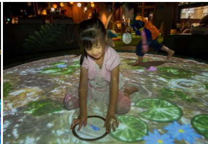
▲草原エリア「ケロケロ池」