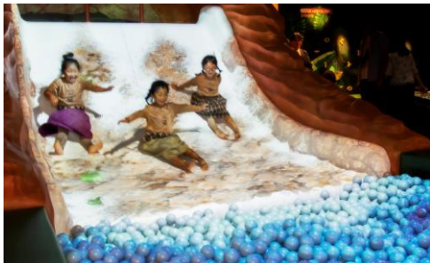
▲ジャングルエリア「ドドドの滝」