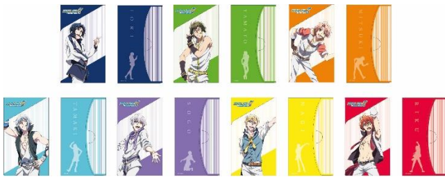
マルチケース 全7種 各500円