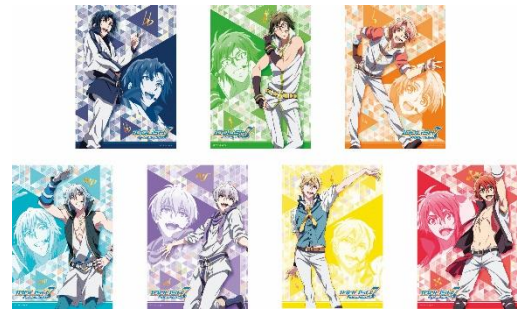
ポートレートカード 全3種 各300円 (ブラインドパッケージ)