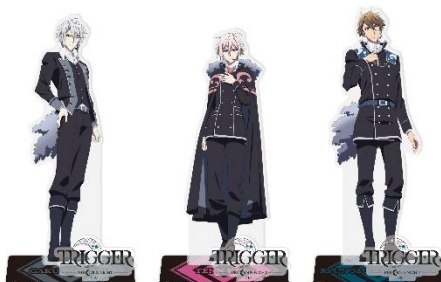
アクリルスタンド 全3種 各1,020円