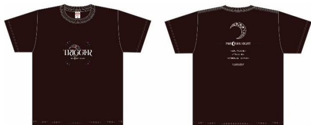
Tシャツ 全1種4サイズ展開(S~XL) 各3,100円