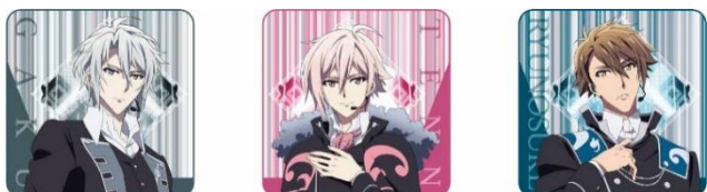
ハンドタオル 全3種 各1,200円