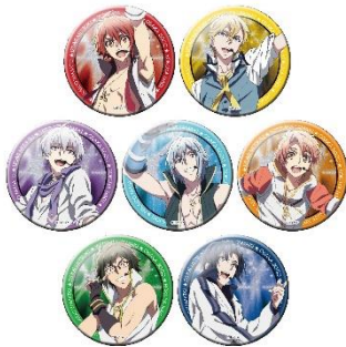
トレーディング缶バッジ 全7種 各510円