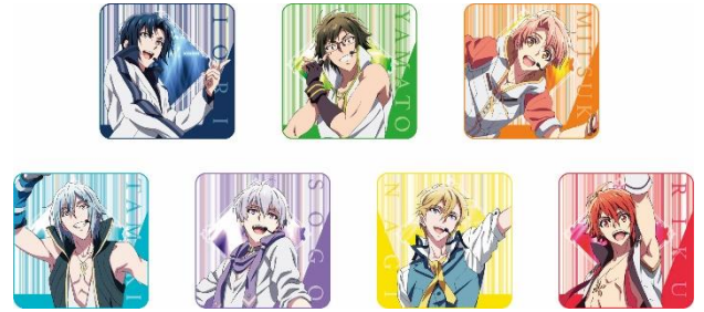
ハンドタオル 全7種 各1,200円