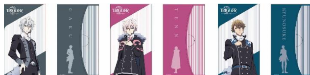
マルチケース 全3種 各500円