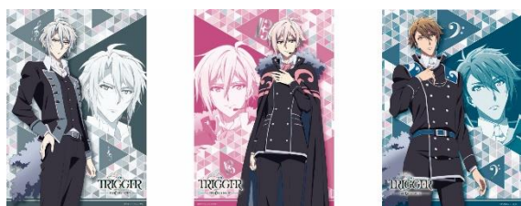
ポートレートカード 全3種 各300円 (ブラインドパッケージ)