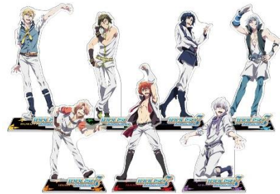
アクリルスタンド 全7種 各1,020円