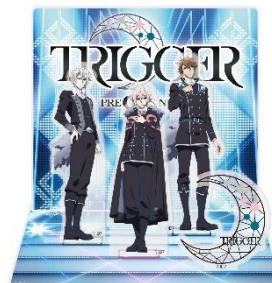
アクリルジオラマステージ 全1種 2,040円