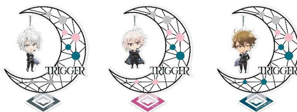
ギミック付きアクリルスタンド 全3種 各1,500円