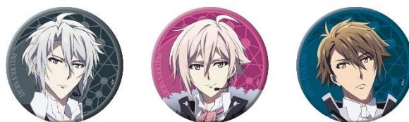
缶バッジ 3種セット 全1種 1,650円