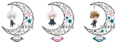
ギミック付きアクリルスタンド 全3種 各1,500円

ライブの公演に合わせて「ギミック付きアクリルスタンド」ほか、「TRIGGER」のオリジナルグッズを8種発売します。