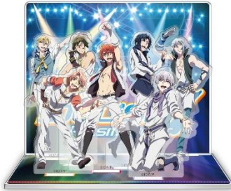
アクリルジオラマステージ 全1種 2,040円