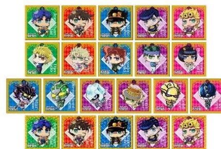
トレーディングステッカー Vol.2(全21種) 価格：350円 ※ランダム2枚封入