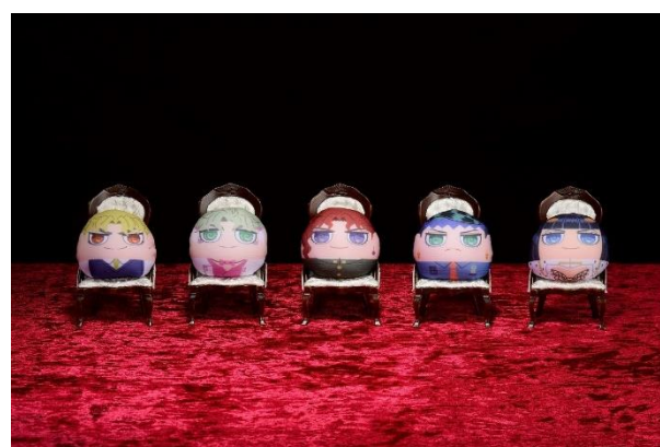
まるぬいぐるみ Vol.2(全5種) 価格：1,000円 ※ランダム封入