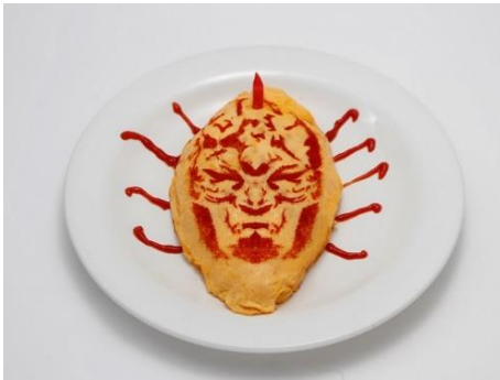
『血は生命なり!』石仮面オムライス 価格：1,300円