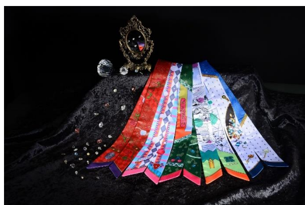
リボンスカーフ Vol.2(全5種) 価格：1,800円