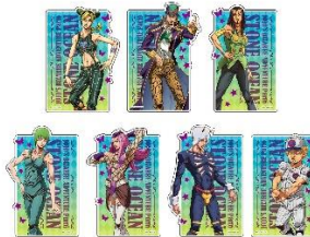
ステッカー賞(全7種) ※ランダム配付