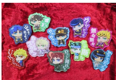
アクリルバッジ(全10種) 価格：750円 ※ランダム封入