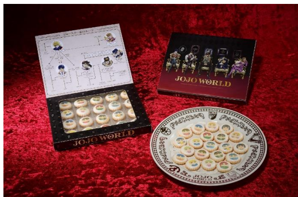
お土産ビスケット(全1種) 価格：850円