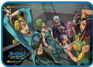
マルチクロス賞(全1種)