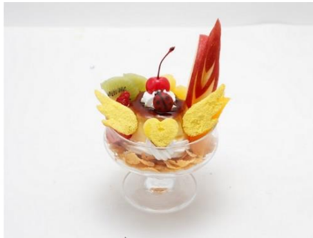
ジヨルノの好物プリン 価格：1,200円