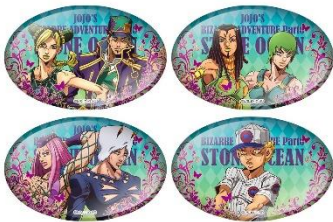
缶バッジ賞(全4種) ※ランダム配付