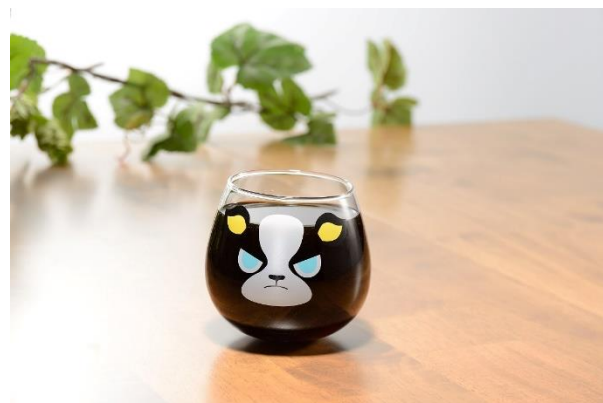
イギーのゆらゆらグラス(全1種) 価格：1,200円