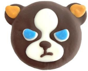
イギードーナツ 価格：650円