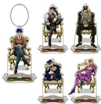
アクリルボールチェーン(全5種) 価格：1,800円