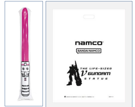
「ガンダムパーク福岡」専用 ビームサーベルバルーン イベント専用景品袋