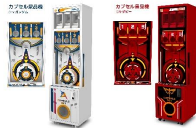
カプセル景品機「ららぽーと福岡専用スポン」