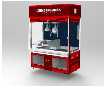
クレーンゲーム機「ららぽーと福岡専用クレナハイブリット」