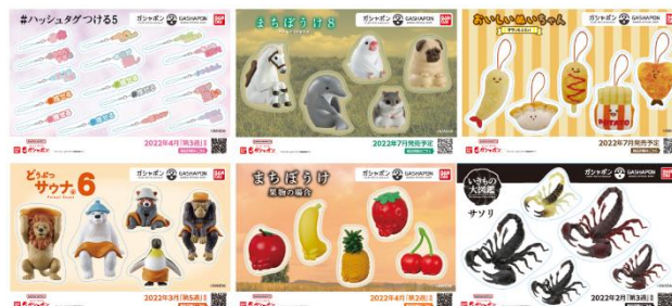
▲オリジナルステッカー(全6種)

キャンペーン期間中にナムコアプリと連動して空カプセル3個を「ガシャポイントステーション」へ入れていただくと「オリジナルステッカー」をプレゼント！