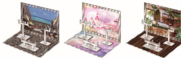
▲おうちでガシャ撮り(全1種)