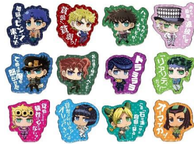
アクリルバッジ (全12種) 価格：750円 ※ランダム封入