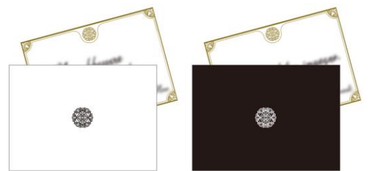
<特典>メッセージレター