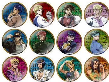
75mm缶バッジ (全12種) 価格：500円 ※ランダム封入