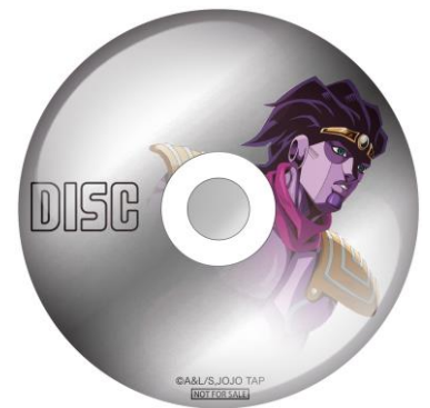
<特典>DISC風缶バッジ(全1種)