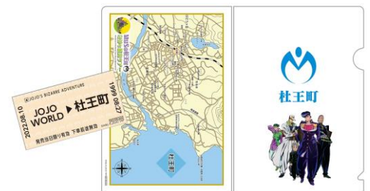
<特典>杜王町観光ツアー参加セット(全1種)