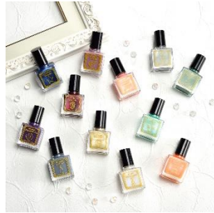
マニキュアセット (全6種) 価格：3,000円