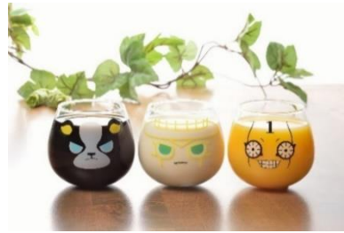
ゆらゆらグラス (全2種) 価格：1,200円 ※「JOJO WORLD」オリジナルグッズ イギーグラス(左)の販売もごさいます。