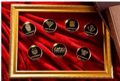
メタル缶バッジ (全7種) 価格：660円