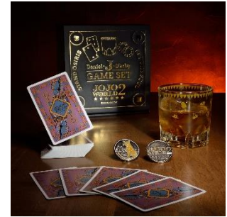
ダニエル・J・ダービー ゲームセット (全1種) 価格：5,000円