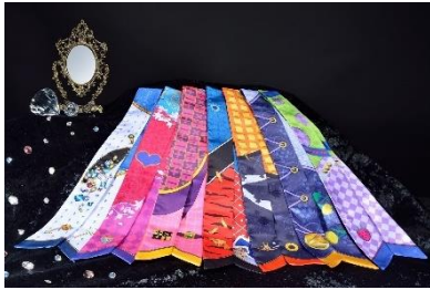
リボンスカーフ (全12種) 価格：1,800円

オリジナルグッズはイベント会場と「ナムコパークス オンラインストア」でも販売します。