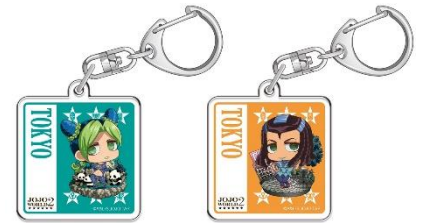
地域限定アクリルキーホルダー (全2種) 価格：600円