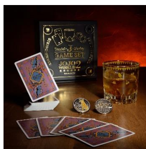
ダニエル・J・ダービー ゲームセット (全1種) 価格：5,000円