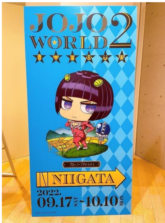
▲地域限定フォトスポット(新潟会場)

©荒木飛呂彦 & LUCKY LAND COMMUNICATIONS/集英社・ジョジョの奇妙な冒険 THE ANIMATION PROJECT