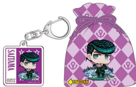
【埼玉会場限定】 東方仗助