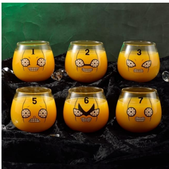
ピストルズのゆらゆらグラスセット (全1種)