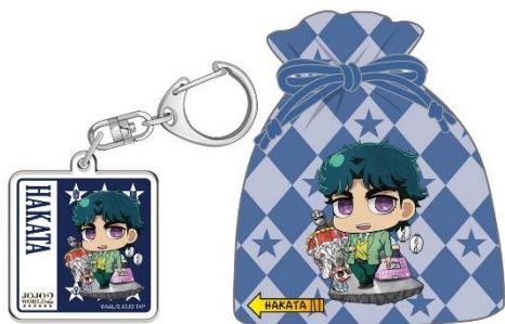
【博多会場限定】 ジョナサン・ジョースター