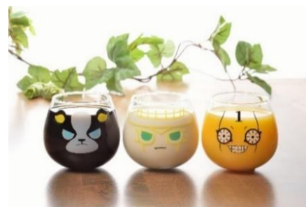
ゆらゆらグラス (全2種) 価格：1,200円

※「JOJO WORLD」オリジナルグッズ イギーのゆらゆらグラス(左)の販売もごさいます。