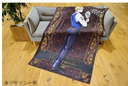
大型ブランケット (全12種) サイズ：2,000×1,300mm 価格：10,000円