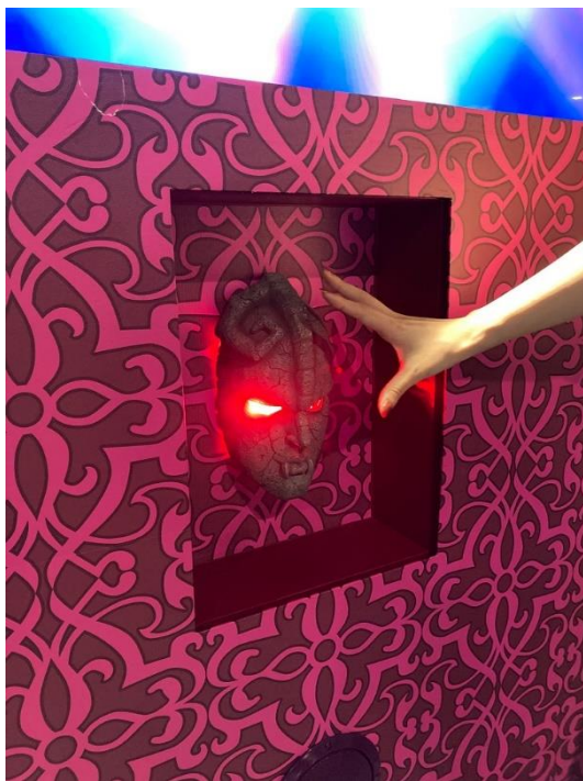
▲ミニゲーム「血の儀式！～石仮面に選ばれし者～」