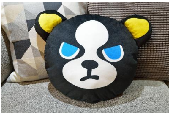
イギードーナツのクッション (全1種)