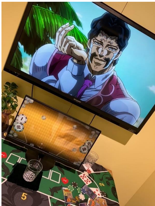
▲アトラクション「グッド！『魂』を賭けよう」