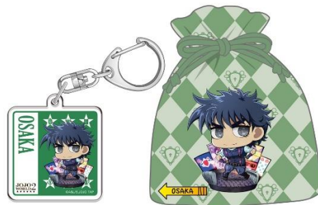
【大阪会場限定】 ジョセフ・ジョースター