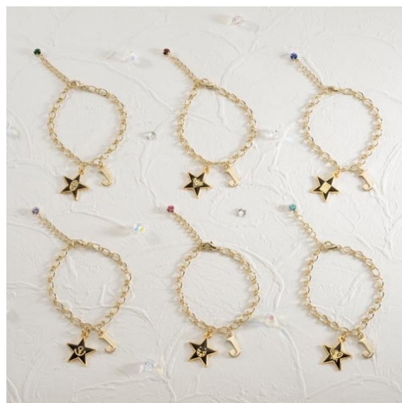
ブレスレット (全6種)