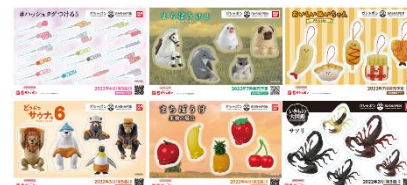
▲オリジナルステッカー(全6種)