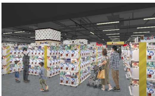
▲『ガシャポンのデパート』池袋総本店

「ガシャポンのデパート池袋総本店」は、国内展開中のカプセルトイ専門店の中で最大級(※1)となる約3,040面の設置面数を誇り、「ガシャポンのデパート」の旗艦店です。アート、カルチャーの発信地、東京・池袋から、日本を代表するトイカルチャーであるカプセルトイの情報を発信する名所として、ここでしか経験できない楽しい買い物体験を提供する施設を目指します。