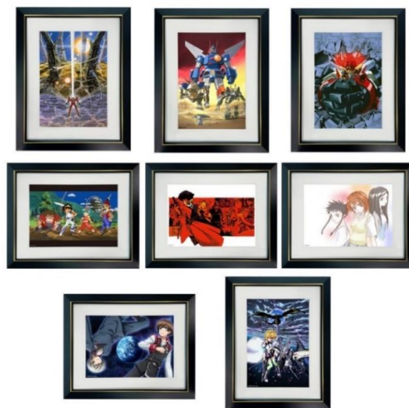
A4キャラファイングラフ(全8種)