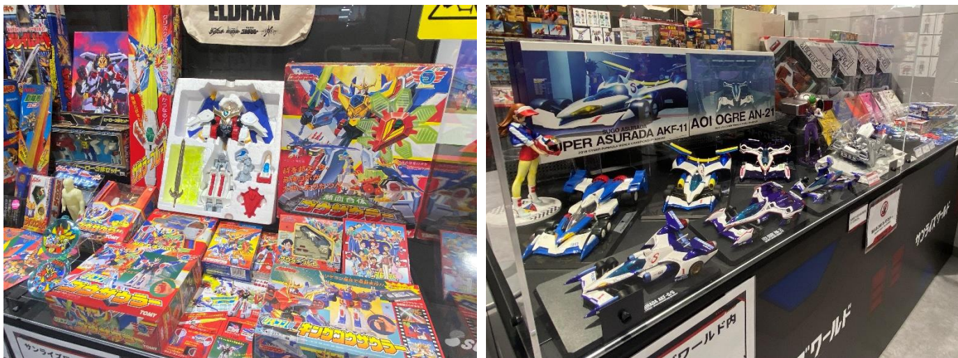
▲「サンライズワールドYOKOHAMA」の様子

入場無料の常設展示エリアでは、過去発売された玩具、作品の設定資料、アーカイブ映像さらに『無敵鋼人ダイターン3』の立像を展示します