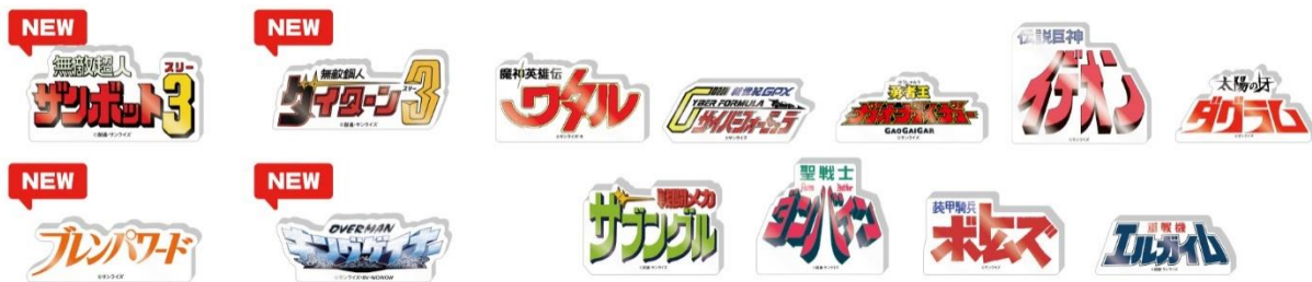
ロゴドミテリア(全13種)