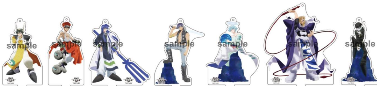
アクリルスタンド (全7種/各 1,200円)