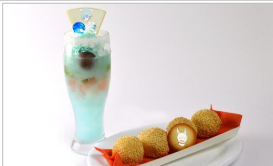
普賢真人の太極符印チョコ入果汁(ジュース)&太公望にあげたごま団子 (780円)