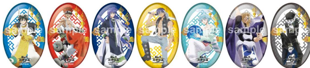
オーバル型缶バッジ (全7種) ※ランダムでお渡し