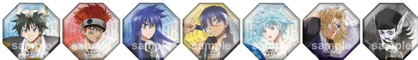
缶バッジコレクション (全7種/1個 378円) ※ブラインドパッケージ仕様