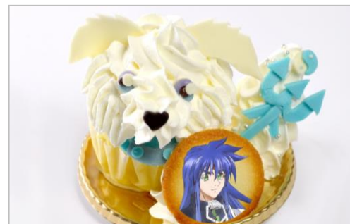
楊戩と哮天犬の仲よしケーキ(レモンの蒸しケーキ) (750円)