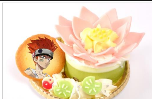
哪吒の蓮の化身ケーキ(レア抹茶ケーキ) (750円)