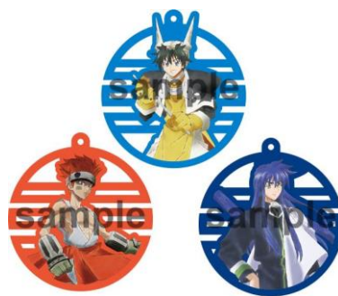
アクリルストラップ (全7種)