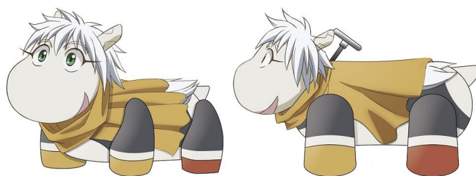
▲スーパ-THE RIDE イメージ

「AnimeJapan2018」で登場した“スーパ-THE RIDE”が、J-WORLD に登場します。(無料でご体験いただけます)