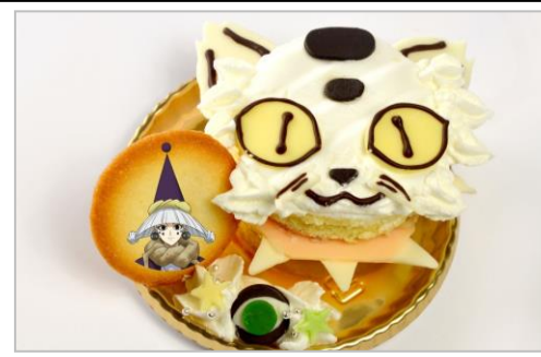
申公豹と黒点虎の千里眼ケーキ(いちごショートケーキ) (750円)