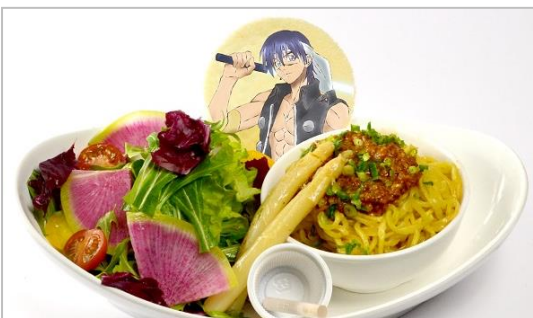
黄天化と道德真君の熱血師弟 サラ冷面担担麺 (990円)