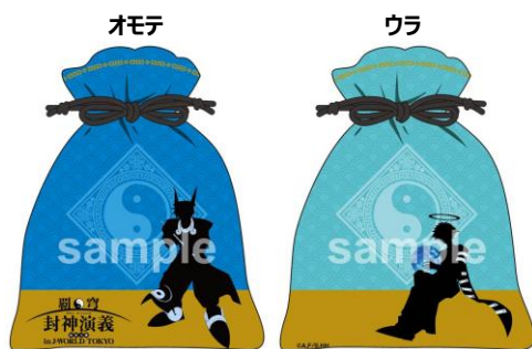
《成功賞》 巾着 (全3種)