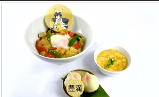
仙桃大吟醸 豊満 桃まん&野菜たっぷり中華丼セット(玉子スープ付) (1,080円)