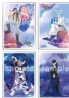
ラミネート風カード (全7種) ※ランダムでお渡し