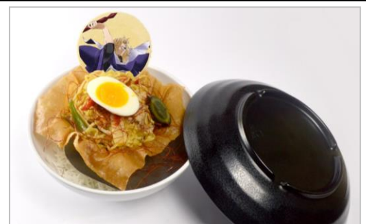
間仲の禁鞭塩焼きそば (980円)