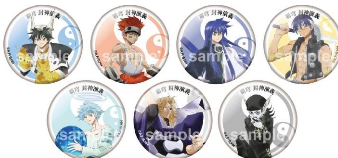
《参加賞》 44mm 缶バッジ (全7種)