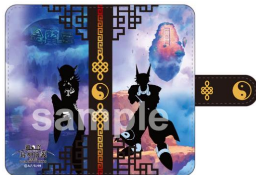
スマホケース (全1種/各 3,780円)