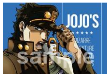
▲承太郎エンド(全2種) ※ランダムでお渡し