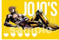
▲DIOエンド(全2種) ※ランダムでお渡し