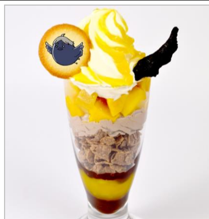
うま うちの連中はちゃんとみんな美味いからな 烏野チョコマンガーパーフェ (810円)

烏野のチームカラー「黒」をイメージしたココアに、オレンジソースをかけたホイップクリームをトッピングしました。