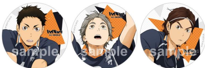
75mm 缶バッジ (全 10 種 / 1 個 378 円) ※ブラインドパッケージ仕様