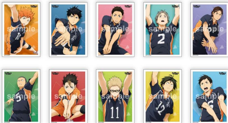
プロマイドコレクション (全 10 種 / 1 枚 270 円) ※ブラインドパッケージ仕様 キャラクターの名前に金箔押しが施されたレア ver.もあります。