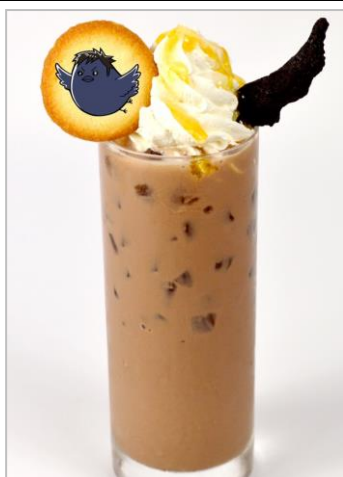
ふるつわもの 見よ 古兵、烏野のココアだ (700円)

黒いパンズにチェダーチーズとパティを挟み、鳥の羽をイメージした真っ黒な羽パイを飾りました。