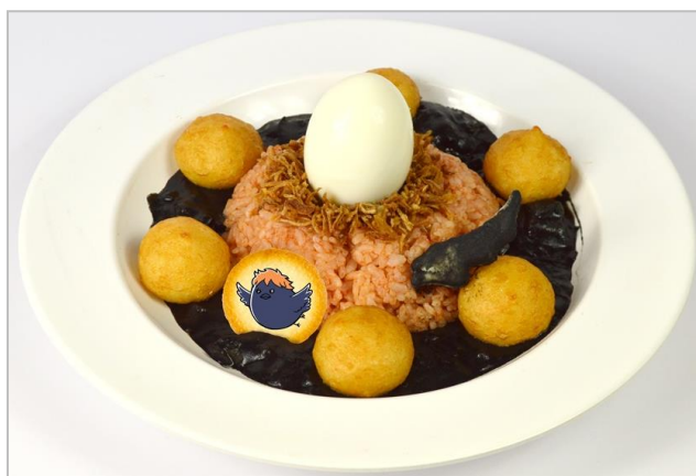
雛鳥に進化の時か…？ 烏野カレー (1,260円)

鳥の巣をイメージしたケチャップライスとオニオンフライの上にゆで卵をのせ、ポテトチーズボールで飾り付けました。