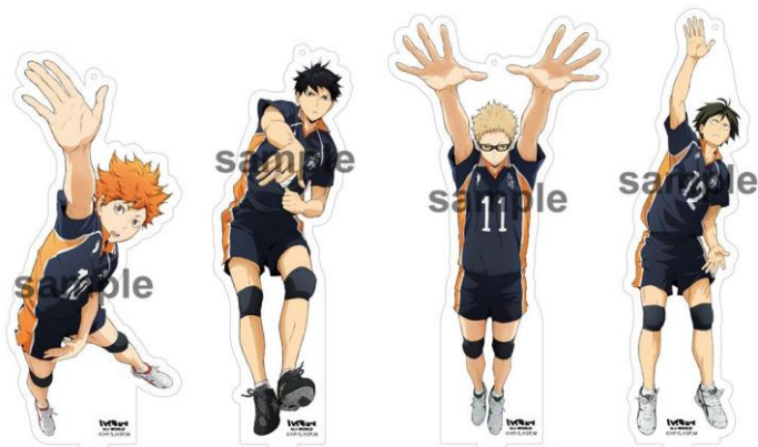
アクリルキーホルダー (全 10 種 / 各 1,620 円)