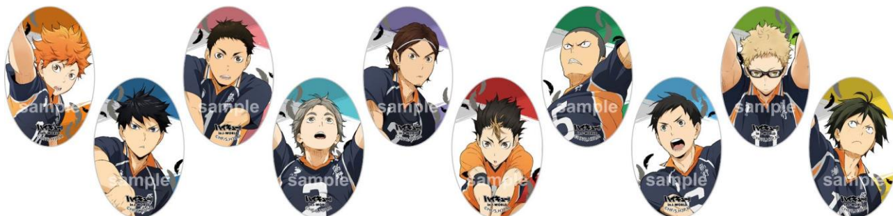
オーバル型缶バッジ (全10種)