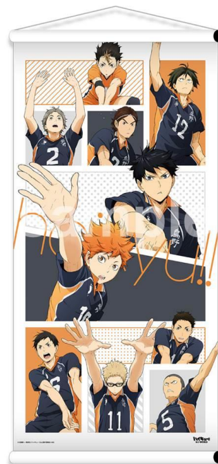
タペストリー (全 1 種 / 2,800 円)