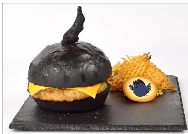
走れ 走れ 跳べ 跳べ これを食べたければ!!! 烏野バーガー (1,080円)

鳥の巣をイメージしたケチャップライスとオニオンフライの上にゆで卵をのせ、ポテトチーズボールで飾り付けました。