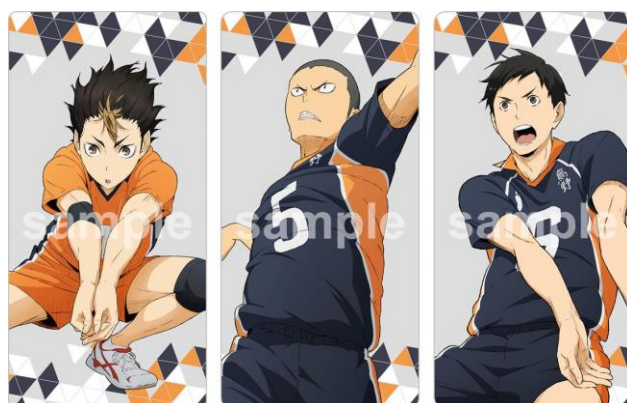
ロングクッション (全 10 種 / 各 2,700 円) ※店頭での受注販売