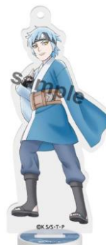
アクリルスタンド (ミツキ) (全 1 種 / 各 800 円)