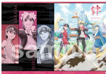
A4 クリアファイル (全 1 種 / 400 円)