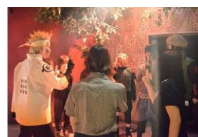
▲「忍戦ツアー」の様子