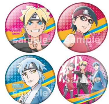
75mm 缶バッジ (全 8 種 / 1 個 400 円) ※ランダム封入