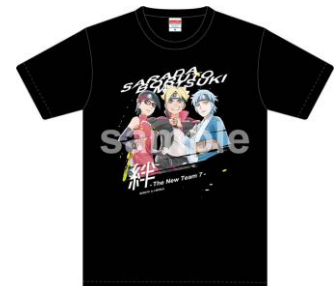
T シャツ (全 1 種 / 3,000 円) ※サイズ…S、M、L、LL