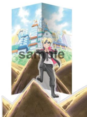
アクリルスタンド (うずまきポルト) (全 1 種 / 各 1,200 円) ※背景付き