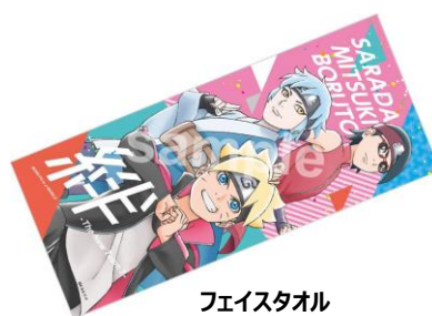
フェイスタール (全 1 種 / 2,000 円)