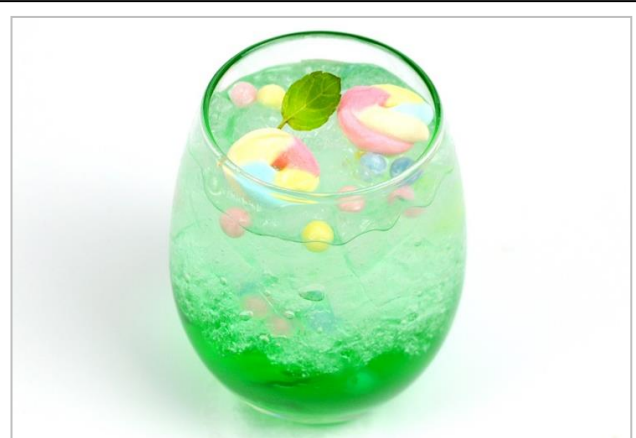
新生第七班のカラフルタピオカソーダ (700 円)

ミントシロップを使用したさっぱりとしたソーダに、ポルト、サラダ、ミツキをイメージしたマシュマロとカラフルタピオカを入れました。