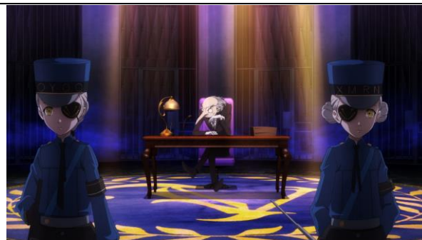
▲作中に登場する『ベルベトルーム』

『ペルソナ 5』の作中に登場する、主人公が夢の中で囚われている監獄の様な部屋『ベルベトルーム』をイメージしたミニゲームが登場。青く光る扉をくぐって、『ベルベトルーム』の独房に入り、鉄格子の間隙から2枚のタロットを選んでください。選んだカードを手前にあるボックスに入ると、目の前のモニターで2枚のカードが合体する演出のあとに現れるカードの絵柄により、もらえる景品が変わります。