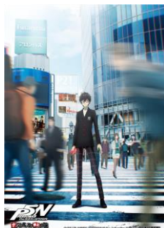
▲オリジナルプロマイド