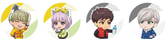
フォーチュンラテ(全12種) 価格：各690円