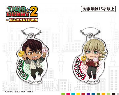
ミニチャームセット(全6種)