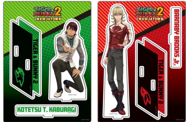
アクリルスタンド(全2種)