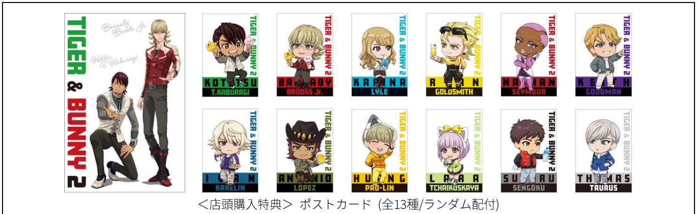
<店頭購入特典> ポストカード (全13種/ランダム配付)