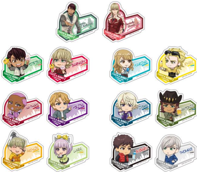
ステッカーコレクション(2枚入り)(全7種/ランダム封入)