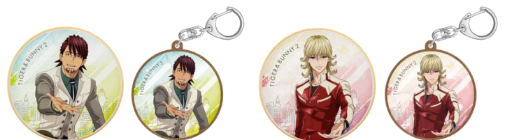
アイシングクッキー 価格：グッズセット 各1,600円 / クッキー単品 各690円