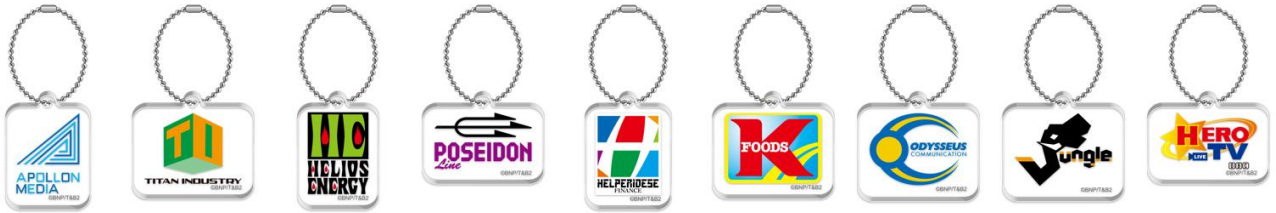
ロゴチャーム(全9種)