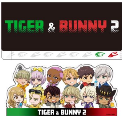
チケットファイルセット(記念プレートつき)(全2種)