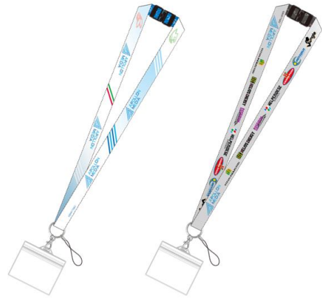
ネックストラップ(クリアカードケースつき)(全2種)