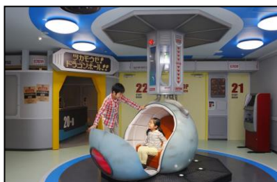
実際に乗ることができる フォトスポット