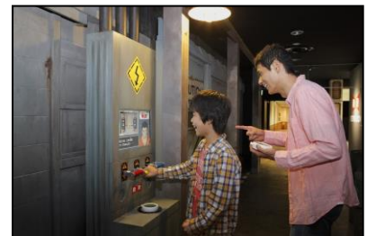
アトラクション 「つかもうぜ！ドラゴンボール」