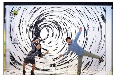
あのシーンを再現できる フォトスポット