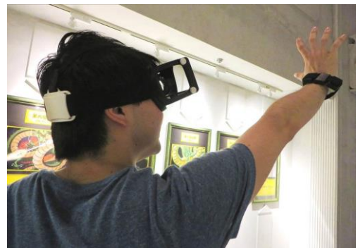
▲ゴーグル型のヘッドマウントディスプレイと腕につけるモーションセンサーを装着し、的に向かってエネルギー弾を放つ(イメージ)