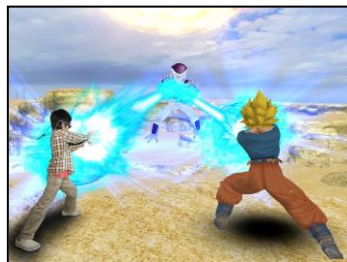
アトラクション 「はなとうぜ！かめはめ波！！」

実際に乗って撮影することができる宇宙船や、キャラクターになりきって撮影できるフォトスポットなども充実！