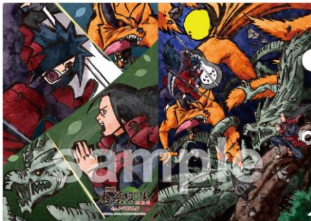
A4 クリアファイル (全1種/378円)

※詳細は J-WORLD TOKYO 公式サイト( http://www.namco.co.jp/tp/j-world/ )でお知らせします。