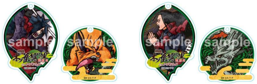
ペアアクリルキーホルダー (全2種/各1,080円)