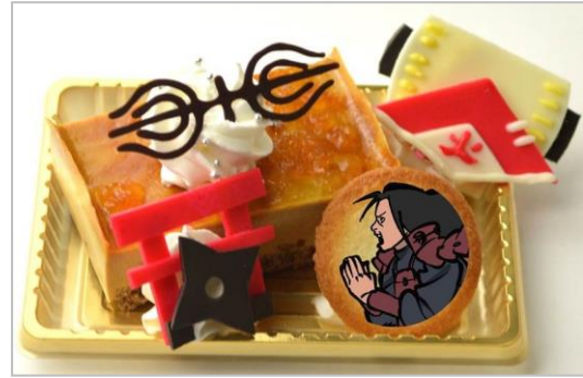
千手柱間の “今こそ見せよう！我が火の意志を！” ケーキ (キャラメルケーキ) (700円)

うちはマダラをイメージしたケーキです。 マダラの万華鏡写輪眼と武器のうちわをチョコで作って飾りました。