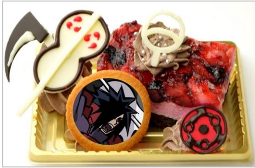
うちはマダラの “うちはこそが忍界最強 誰も止めることはできん” ケーキ (ダブルベリーケーキ) (700円)

うちはマダラをイメージしたケーキです。 マダラの万華鏡写輪眼と武器のうちわをチョコで作って飾りました。