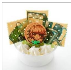
千尋の超高校級のプログラマーソフトクリーム