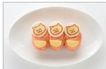
七海のネコリュック餃子