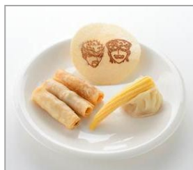
友情対決!! 石丸チョコク型餃子VS 大和田バターコーン味餃子