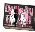
ポストカード アルバム