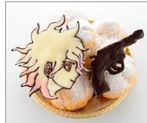
狛枝の幸運ロシアン ルーレットシュークリーム