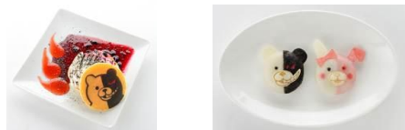
モノクマパンケーキ モノクマ&モノミ餃子劇場

「ダンガンロンパ」のキャラクターなどをモチーフにしたオリジナルデザート&フードが全15種登場します。1品お買い上げごとにオリジナルブロマイドを1枚プレゼント!