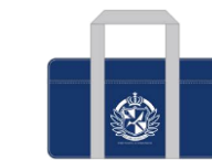
希望ヶ峰学園指定バッグ風 ゲーム機ポーチ