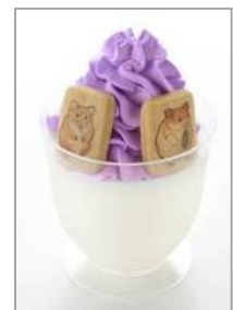
破壊神暗黒四天王プリン