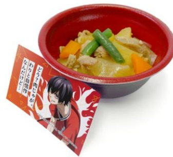
「おすそ分けしようと思って」 王城正人の得意な肉じゃが 価格：950円