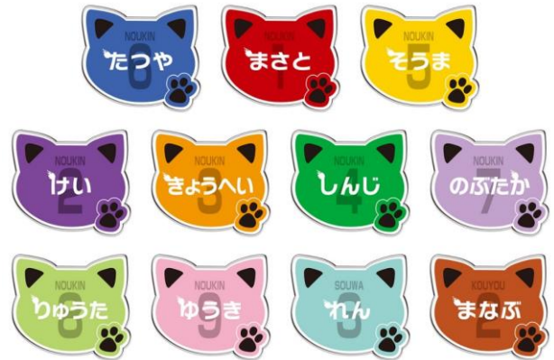
ネームバッジコレクション (全11種) 価格：1個700円 ※ランダム封入