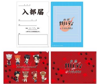
クリアファイル2枚セット (全1種) 価格：880円