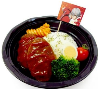
ナイトエンドが作ってみた!? 宵越竜哉のデミハンバーグ丼 価格：950円