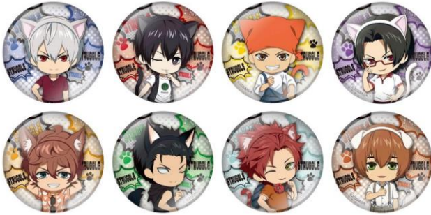
缶バッジコレクション (全8種) 価格：1個450円 ※ランダム封入