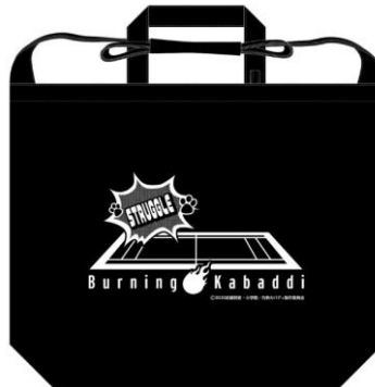
2WAYトートバッグ (全1種) 価格：2,500円