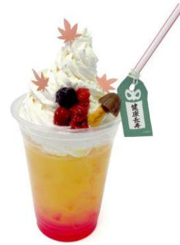
埼玉紅葉高校の 山の木の実添えオレンジジュース 価格：890円