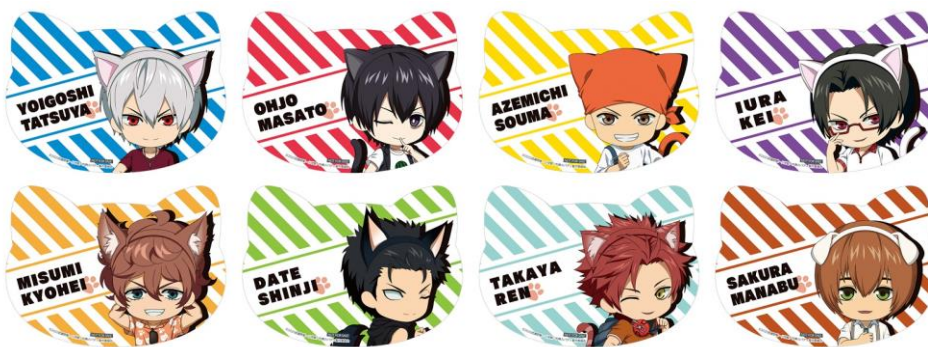
オリジナルねこ型カード (全8種)

池袋での会期終了後に、会場で販売したオリジナルグッズの受注販売をインターネット通販で行います。