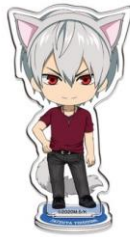
アクリルスタンド (全8種) 価格：各1,200円