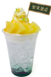
「堅実強固」 奏和高校の爽やかミントドリンク 価格：890円