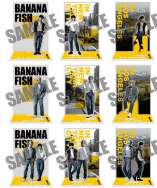
「BANANA FISH」The Stage -前編- ランダムアクリルスタンド (全9種) 価格：1個1,100円 ※ランダム封入