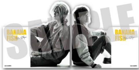
「BANANA FISH」The Stage -前編- ひとことふせん 2種入り (アッシュ・英二) 価格：1セット1,100円