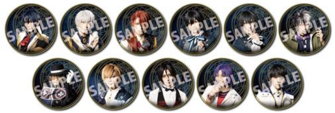
舞台『魔法使いの約束』第1章 ランダム缶バッジ (全11種) 価格：1個500円 ※ランダム封入

©吉田秋生・小学館／「BANANA FISH」The Stage製作委員会 ©coly／舞台まほやく製作委員会