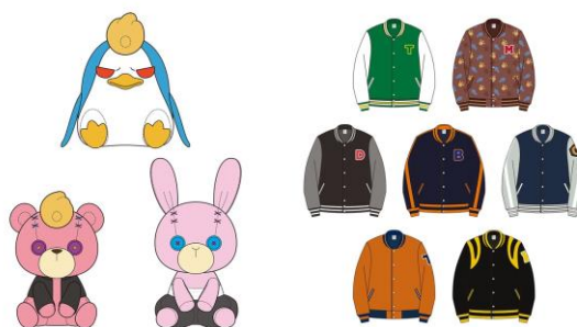
▲ Twitter キャンペーン賞品